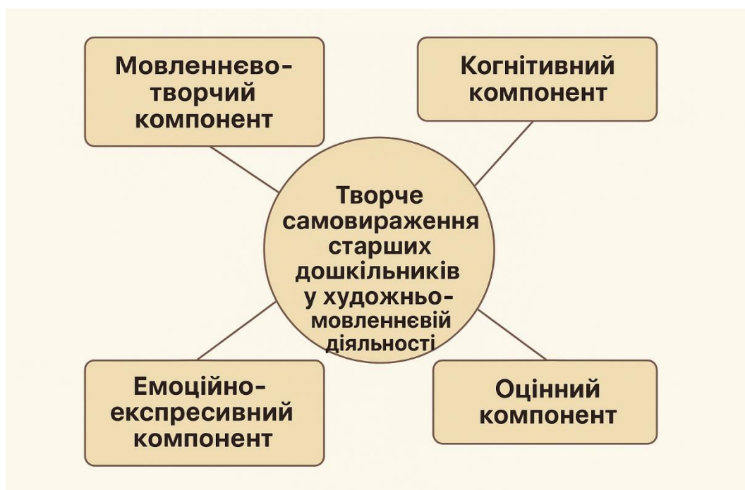
Рисунок 1.1. Складові розвитку творчого самовираження старших дошкільників у процесі художньо-мовленнєвої діяльності

Отже, розвиток творчого самовираження дитини під впливом художньої літератури потребує об'єднання всіх видів художньо-мовленнєвої діяльності дітей на основі встановлення єдності їхніх завдань; зв'язків з іншими видами діяльності дітей; гармонійного поєднання всіх форм художньо-мовленнєвої діяльності. Вирішенню означених проблем присвячено наступний розділ кваліфікаційної роботи.