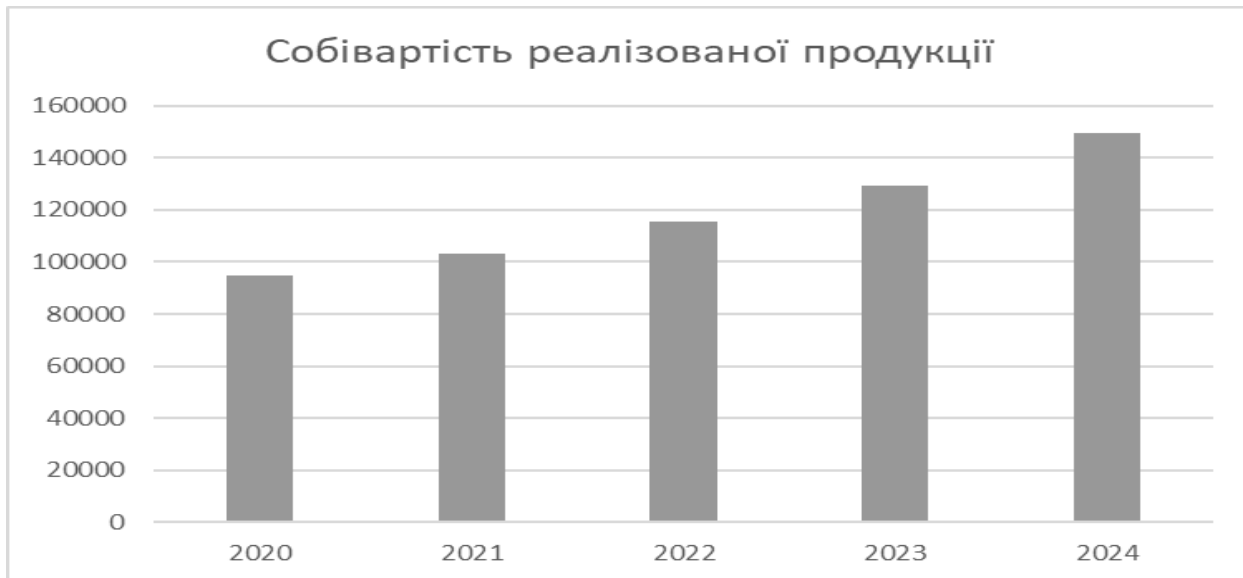
Рис. 2.5 Собівартість реалізованої продукції (товарів, робіт, послуг)