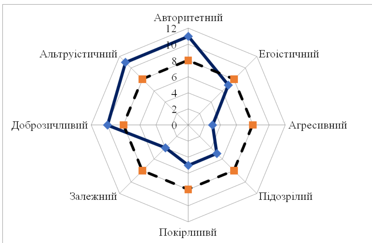
Рис.3.1. Міжособистісний стиль спілкування тренера з юними спортсменами

Емоційний бар'єр виникає внаслідок невідповідності емоційного стану учасників взаємодії та негативних переживань, які спотворюють сприйняття інформації [29].