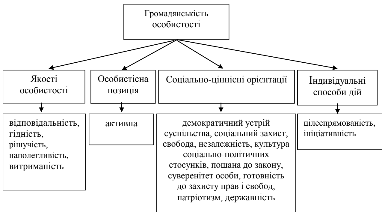
Рис. 1. Складові громадянськості в аспекті виховної діяльності у 1917–1920 рр. ХХ століття

нею, ще деякій час відображалася у педагогічних поглядах діячів наступного періоду, але вже змінивши певні громадянські орієнтири.