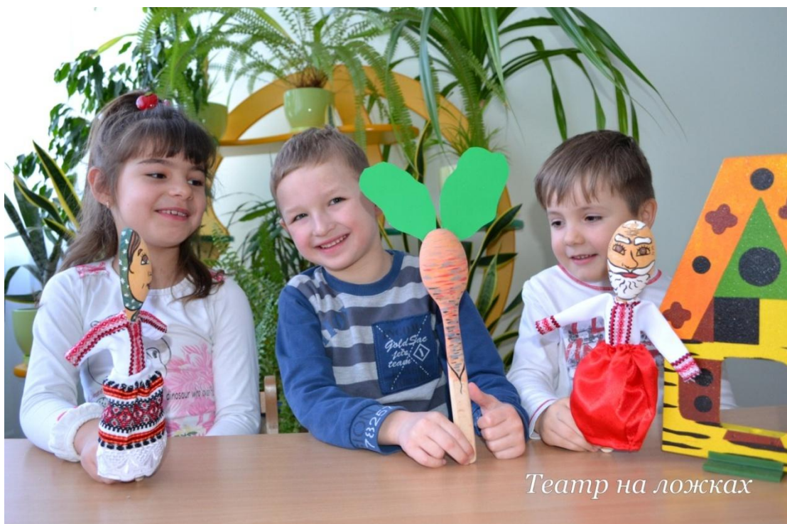
Театр на ложках