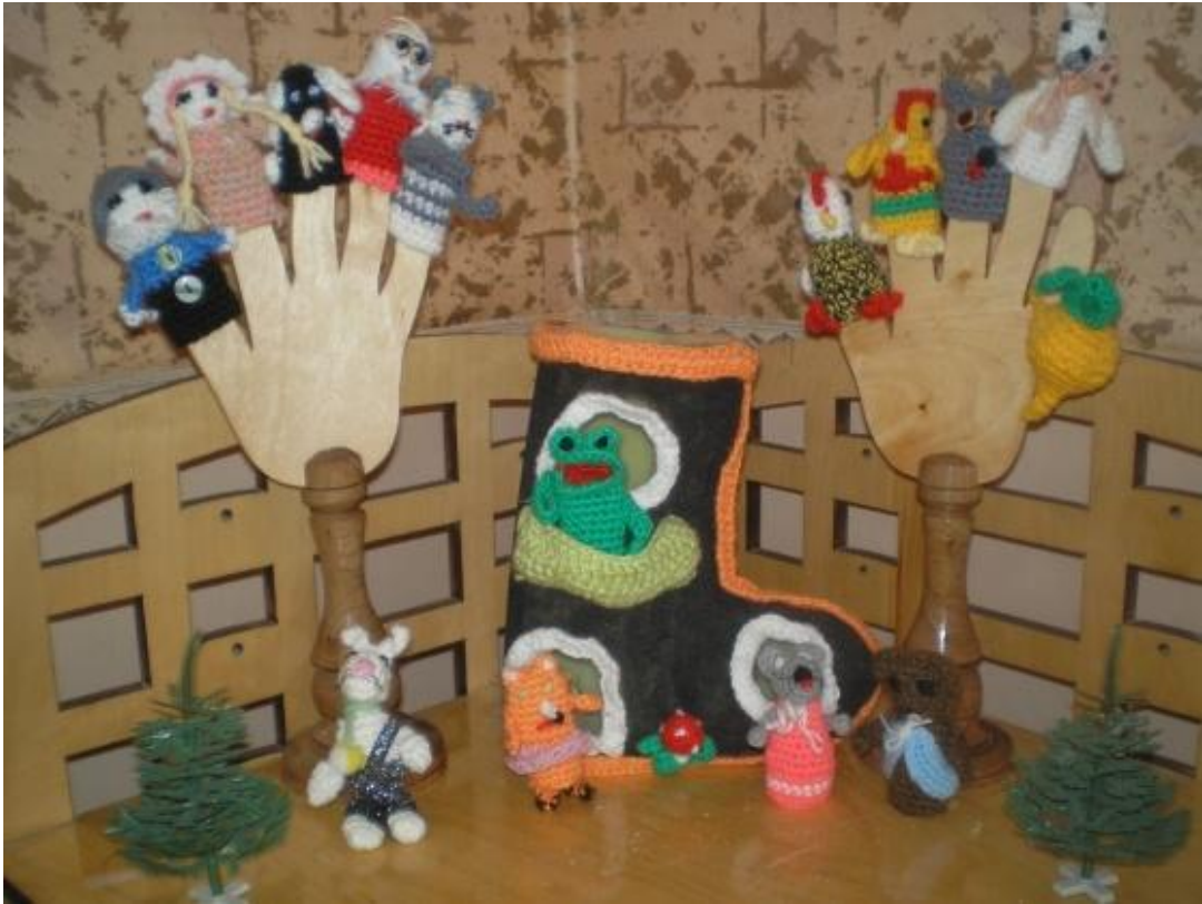
Паперовий театр «Оригамі»