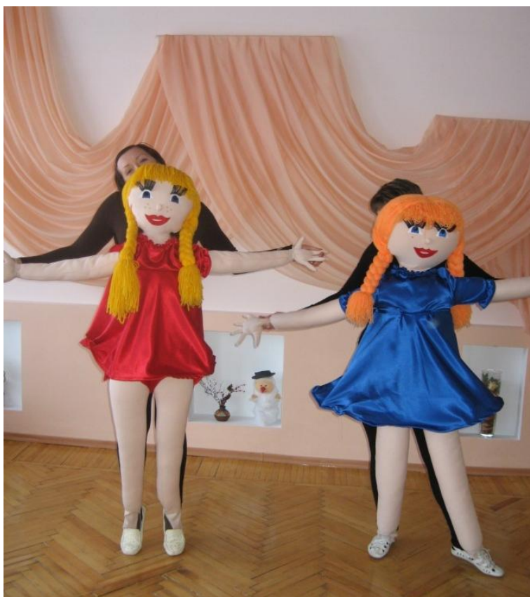
Театр «Естрадної ляльки»