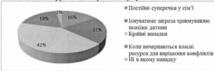
Рис. 2. Випадки, які б зумовили подружжя звернутися по соціально-психологічну допомогу до фахівця

Для того, щоб визначити на скільки є актуальною соціально-психологічна допомога, ми запитали молодого подружжя чи задумувалися вони про соціально-психологічну допомогу фахівців, щодо вирішення сімейних конфліктів або непорозумінь, і з'ясували, що 49% опитаних не задумувалися про дану допомогу, так як в змозі самі вирішувати всі сімейні непорозуміння, 18% респондентів стверджують, що у них ще поки не було необхідності звертатися по допомогу до фахівців, 17% опитаних – задумувалися над цим, але не наважувалися звернутися, 9% респондентів все ж таки зверталися за даною допомогою, і лише 6% опитаних вважають це абсурдним, тому і не задумувалися над цим.