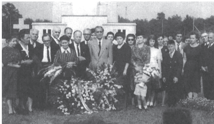
Похорон Тодося Осьмачки, 1962 р.