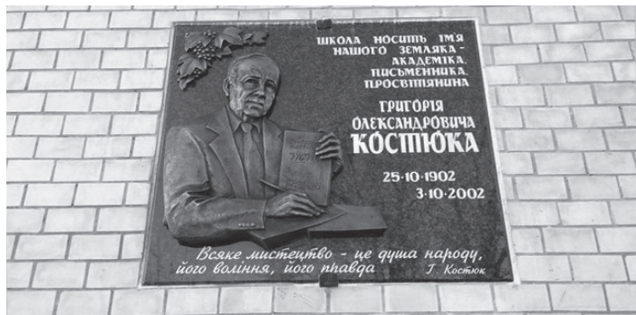
Меморіальна дошка Г. Костюка на фасаді школи у с. Боршиківці Кам'янець-Подільського району. 2017 р.