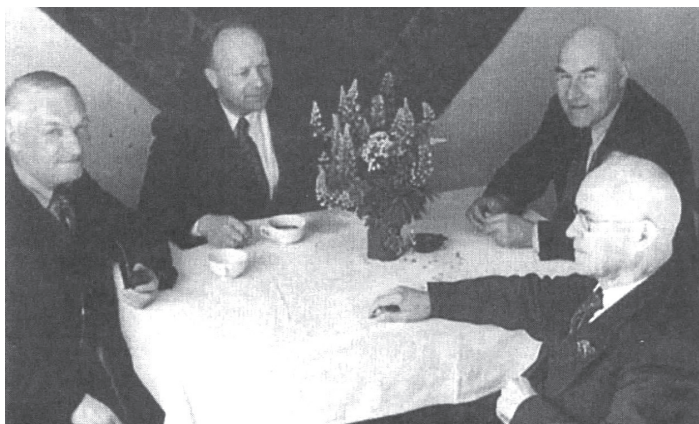
Один із організаторів і член УНРади. Зліва направо: Степан Чернецький, Григорій Костюк, Спиридон Довгаль і проф. Борис Іваницький (голова УНРади). Очевидно, друга сесія УНР, 1949 р., Аугсбург.