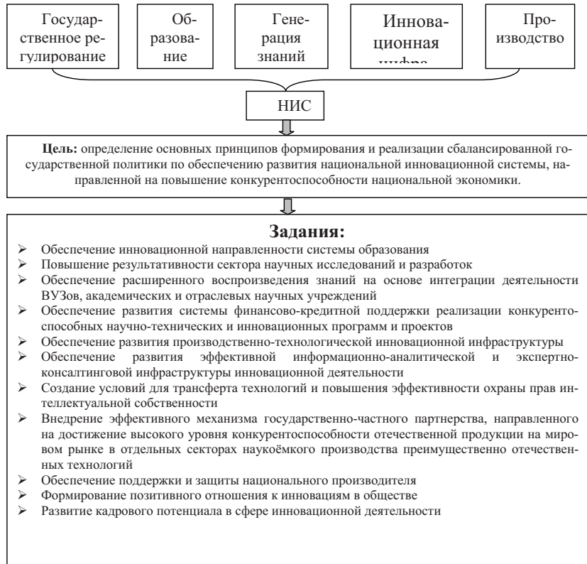
Рисунок 1. Назначение НИС Украины.