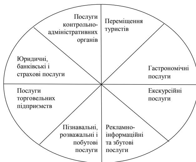
Рис. 1. Послуги інфраструктури територіально-туристичного поєднання

Інфраструктуру окремого територіально-туристичного поєднання дослідники М. Рутинський і О. Стецюк розглядають у такому поєднанні послуг (рис. 1):