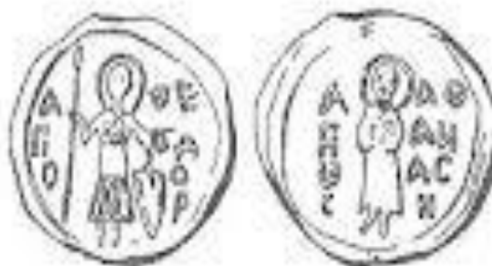
Печатка кн. Ярослава Афанасія Ярославича

(Северо-Восточная Русь – [Электронный ресурс] режим доступа: http://ru.wikipedia.org/wiki/%