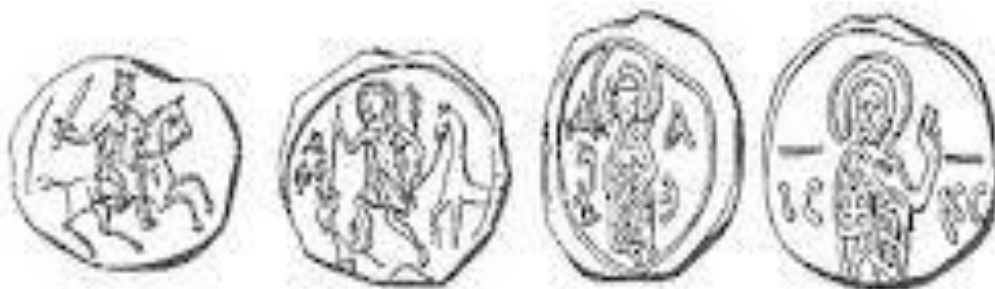
Печатки кн. Олександра Невського