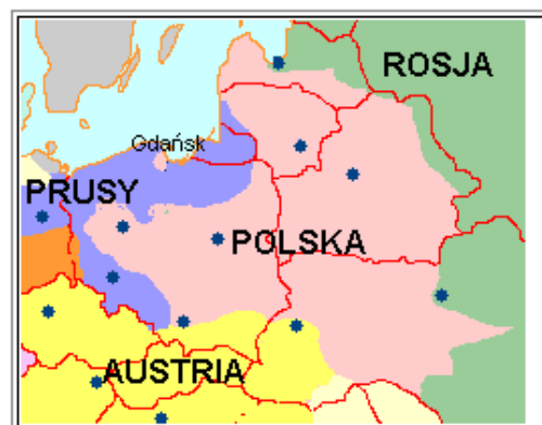
После I раздела в 1772 году