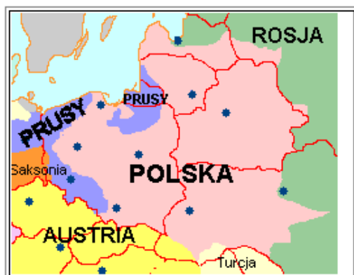
Польша до разделов