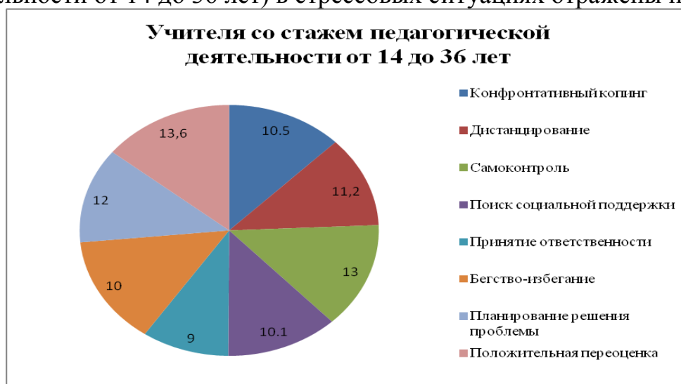
Рис. 2. Гистограмма копинг стратегий опытных педагогов (со стажем педагогической деятельности от 14 до 36 лет)

Стратегии поведения опытных учителей (со стажем педагогической деятельности от 14 до 36 лет) в стрессовых ситуациях отражены на рис. 2.