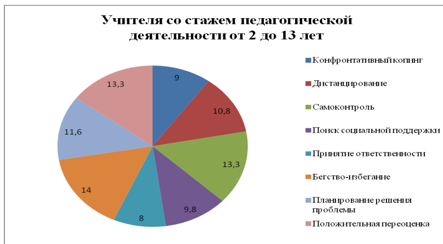
Рис. 1. Гистограмма копинг-стратегий молодых педагогов (со стажем педагогической деятельности от 2 до 13 лет)

Анализ полученных результатов. С помощью методики «Стратегии преодоления стрессовых ситуаций (SACS) были выявлены стратегии молодых педагогов (Рис. 1).