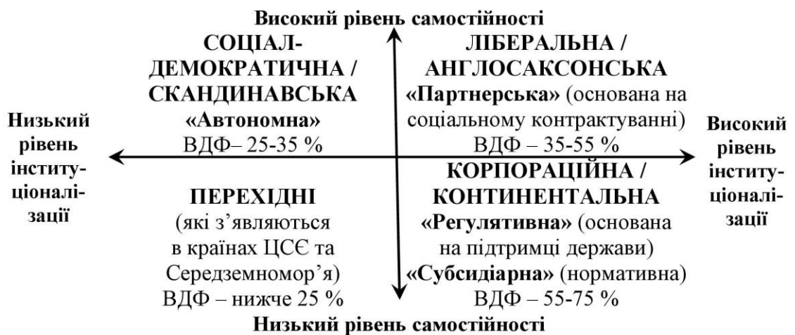
Рис. 1. Двовісна діаграма моделей співробітництва між державним і недержавним суспільними секторами щодо організації надання соціальних послуг у країнах Європи [5, с. 30]