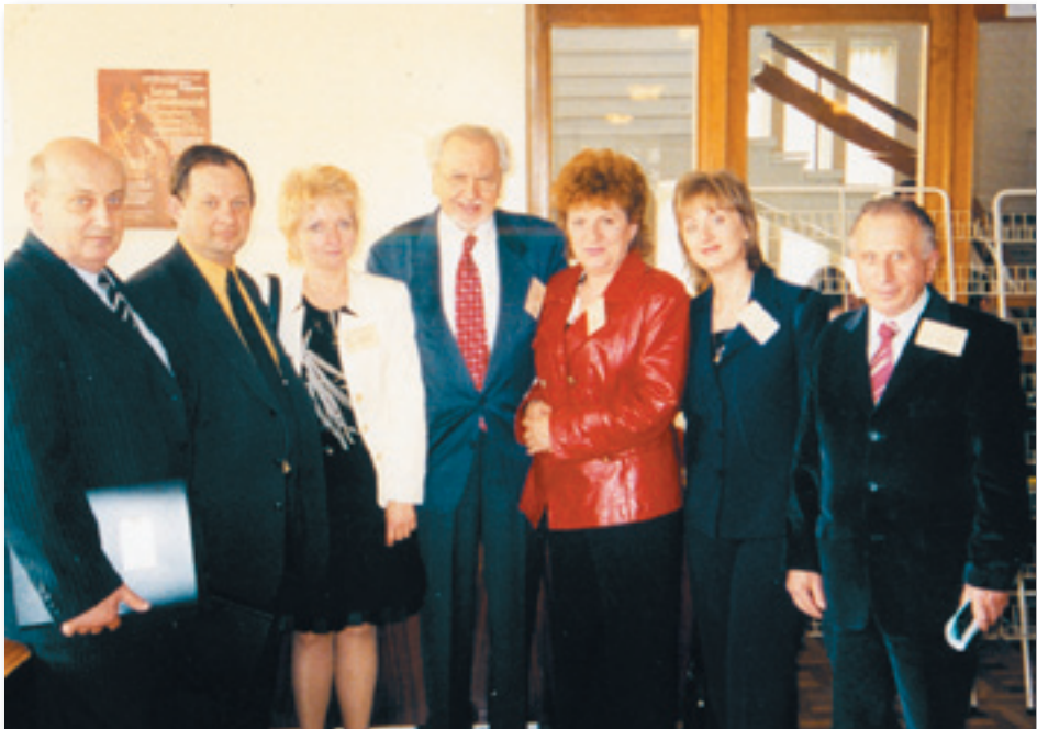
Чернівецька делегація на III міжнародному конкурсі українських істориків у Луцьку з професором Любомиром Винаром (18 травня 2006 р.)