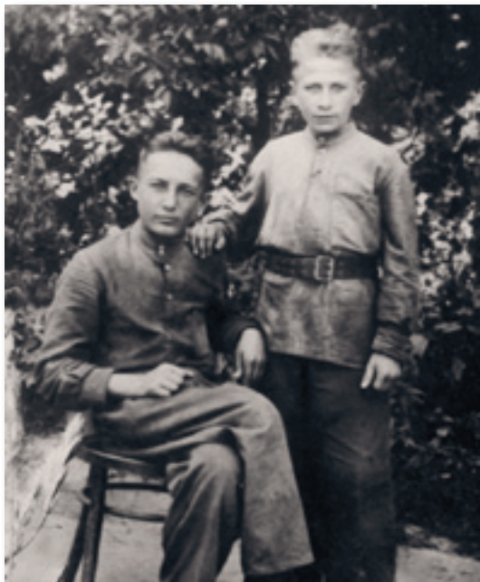
У школі ФЗН (Львів, 10.07.1947 р.)