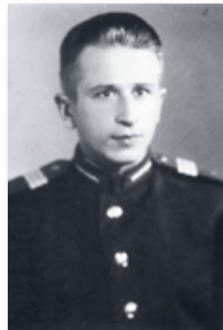
Сержант Радянської армії (1952 р.)