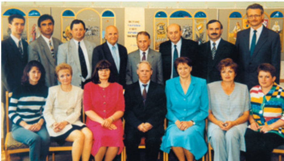
У колективі кафедри історії України ЧНУ імені Юрія Федьковича