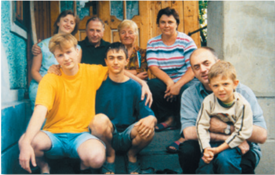
Батьки, діти й онуки в Ярузі на Могилівщині (2005 р.)