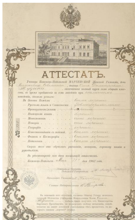
Іл.1. Аттестат про закінчення гімназії