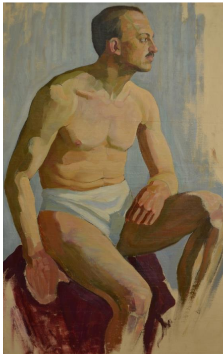
Іл.2. Портрет Натурника після закінчення реставрації