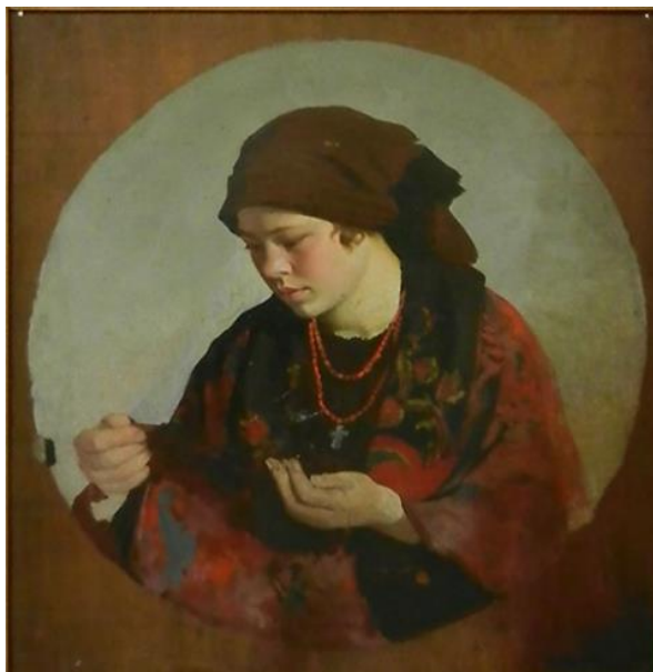
Іл.2. Картина Ольги Жудіної