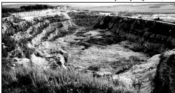
Рис. 1. Промисловий кар'єр із видобутку вапняків поблизу с. Вербка

Найсильнішого незворотнього впливу рендзини досліджуваної території зазнають, внаслідок гірничодобувних робіт для цукрової промисловості та будівництва. На території Подільських Товтр (як в межах головного пасма, так і на бічних товтрах) зосереджено понад 80 кар'єрів, більшість із яких є діючими, що становить близько 1% площі території (рис. 1).