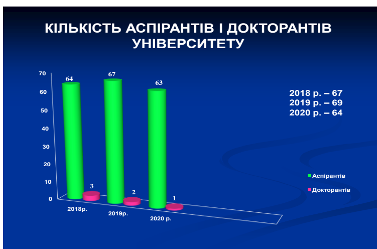
Рис. 3. Кількість аспірантів і докторантів університету