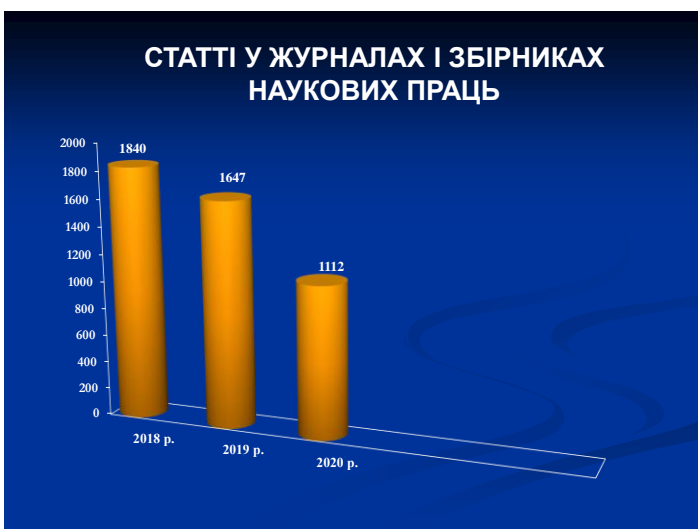
Рис. 6. Статті у журналах та збірниках наукових праць