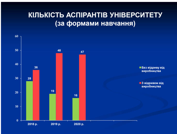
Рис. 4. Кількість аспірантів університету (за формами навчання)