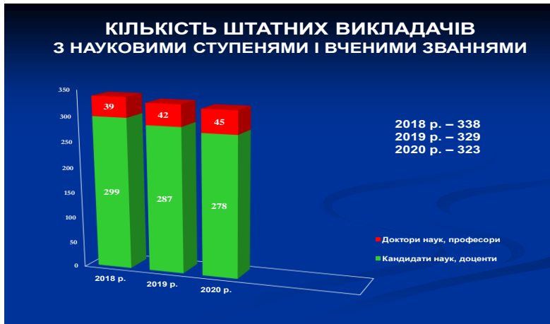
Рис. 1. Кількість штатних викладачів з науковими ступенями і вченими званнями