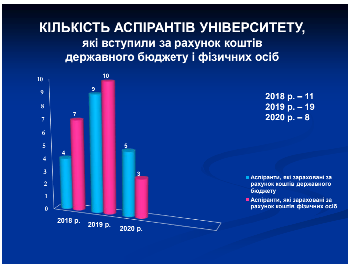
Рис. 5. Кількість аспірантів університету, які вступили за рахунок коштів державного бюджету і фізичних осіб