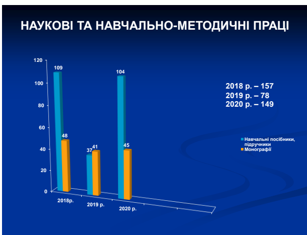
Рис.8. Наукові та навчально-методичні праці.