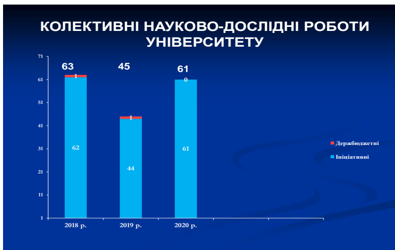
Рис. 2. Колективні науково-дослідні роботи університету