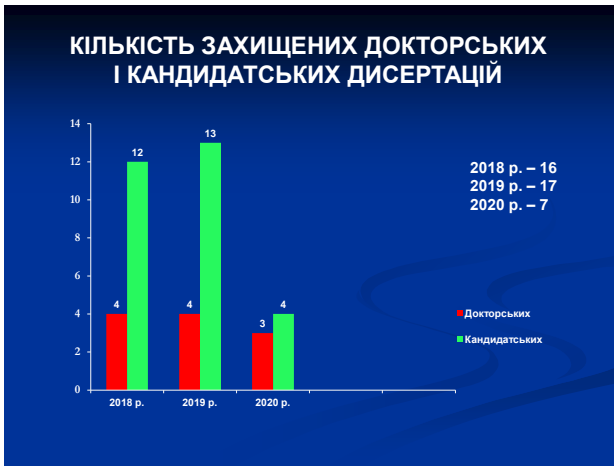
Рис.7. Кількість захищених докторських і кандидатських дисертацій