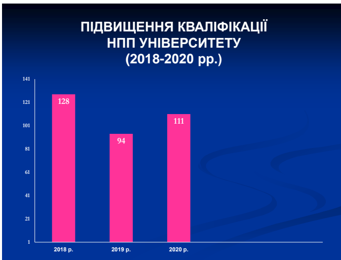
Рис. 11. Підвищення кваліфікації НПП університету (2018-2020 рр.)