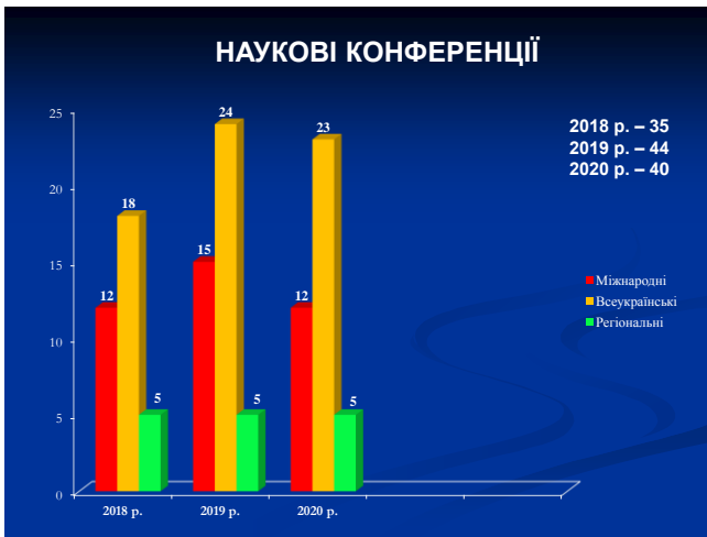
Рис. 10. Наукові конференції