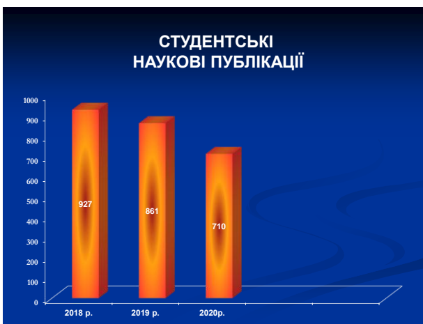
Рис. 12. Студентські наукові публікації