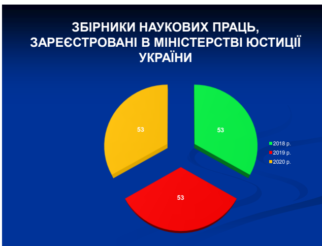
Рис. 9. Збірники наукових праць, зареєстровані в міністерстві юстиції України