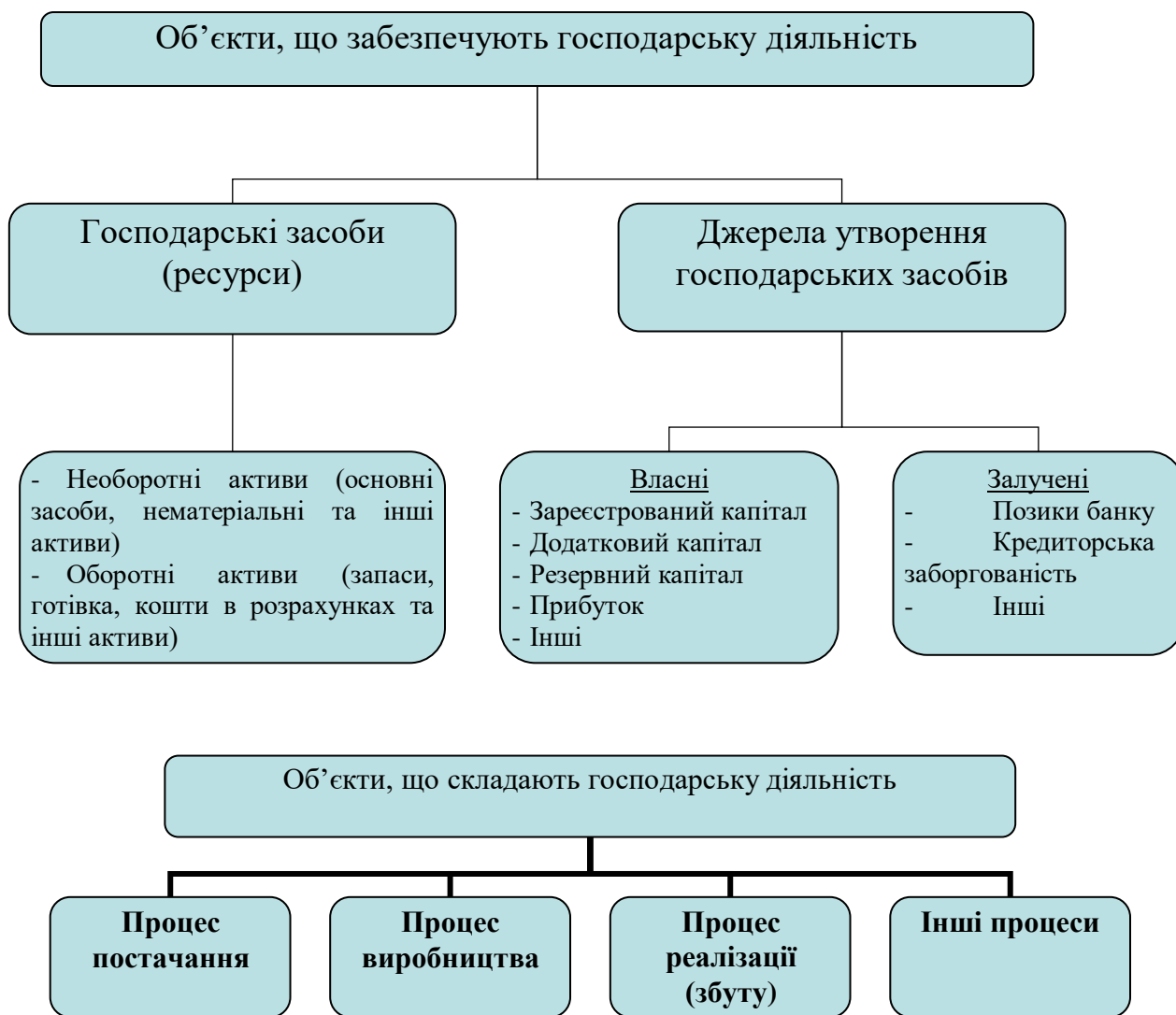
Рис. 2.1. Об'єкти фінансового обліку

Ознайомитись із рисунком 2.1. Дати визначення основних понять, що є об'єктами бухгалтерського обліку.