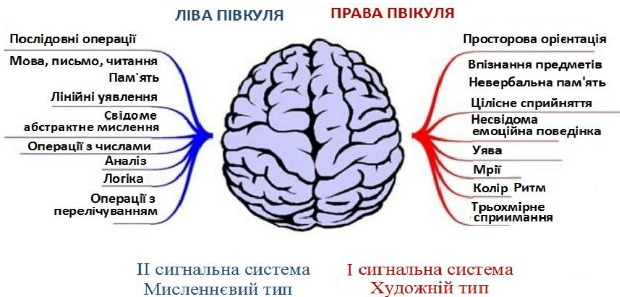
Рис. 1. Функціональна діяльність півкуль головного мозку

Мовлення являє собою одну зі складних вищих психічних функцій людини. Органи мовленнєвого апарату управляються клітками кори головного мозку (що розташовані в мовних центрах), а також підкірковими утвореннями та центробіжними нервовими волокнами які забезпечують узгоджену роботу всіх мовленнєвих органів.