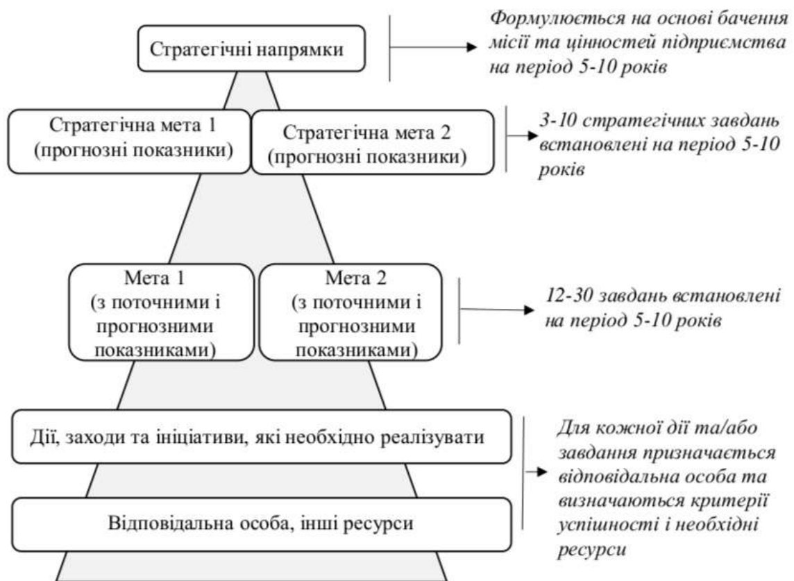
Рис. 1. Процес формування стратегічних цілей підприємства.

також на призначення осіб, відповідальних за їх виконання.