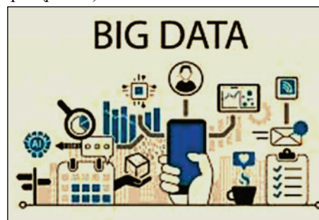
Рис. 2. Технології пошуку Big Data

5. Технології Big data. Технології Big data дозволяють збирати та аналізувати великі обсяги даних з інженерії, економіки, технологій. Вони можуть використовуватися для збору статистичних даних, для кваліфікаційних робіт та розробки індивідуальних освітніх траєкторій (рис. 2).