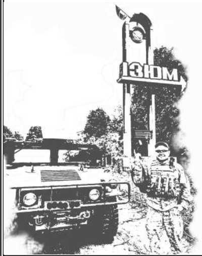
ДЕНИС, 31 рік