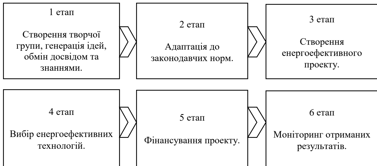
Рис. 3.2. Алгоритм впровадження енергоефективних технологій для ПП «Капітал-Буд сучасне будівництво»

Для розробки і впровадження енергоефективного проєкту у будівництво наступних житлових комплексів ПП «Капітал-Буд сучасне будівництво» пропонується розбити даний інноваційний процес на етапи, для полегшення сприймання та можливості детального обґрунтування кожного з них (рис. 3.2).