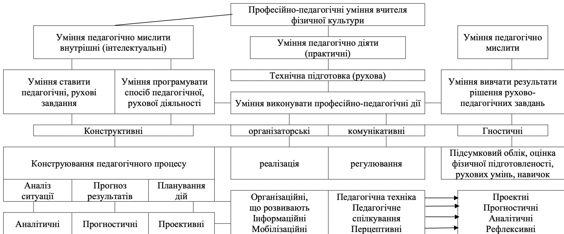
Рисунок 1.1. Модель змісту практичної готовності вчителя фізичної культури