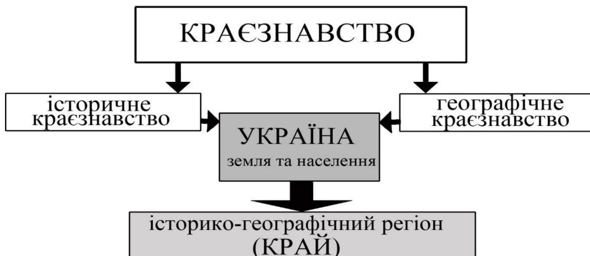
Рис. 1.1. Методологічна структура краєзнавства

Ці складові у сукупності не проста сума доданків, а якісно нове утворення, яке покращує ефективність наукових пошуків. Така наукова позиція дозволяє розглядати усі природні та суспільні явища одночасного в хронологічному та просторовому аспектах і відповідно забезпечує цілісне охоплення об'єкта дослідження (рис. 1.1).