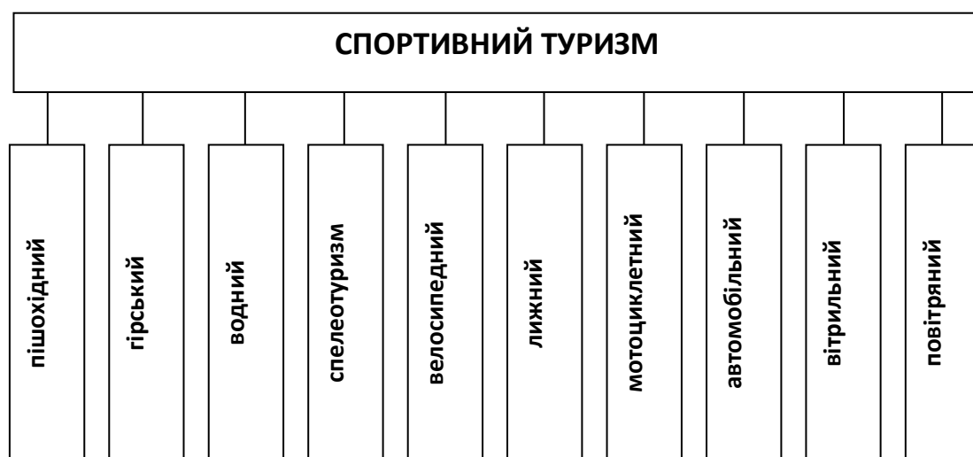
Рис. 7.1. Структура спортивного туризму

Напрямки спортивного туризму розрізняють за способом та умовами руху (рис. 7.1).