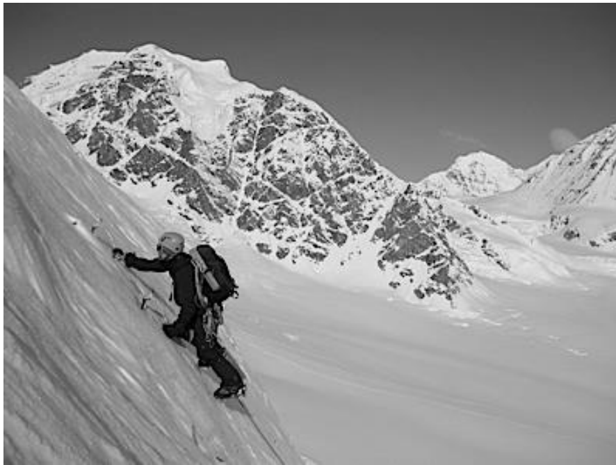
Рис. 7.2. Рух по льодовому схилу

Розпорядок дня гірської подорожі звичайно зміщується на 1-4 години порівняно з розпорядком пішохідного. Це, передусім, пов'язано з тим, що вночі завдяки замерзанню, рухоме каміння закріплюється і, рух безпечний доки сонце його не нагріло. Удень також збільшується водність в гірських річках внаслідок танення снігу та льоду, що ускладнює їх подолання.