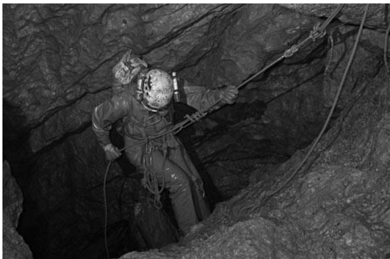
Рис. 7.3. Вертикальний спуск у печеру

У печерах зазвичай спостерігається висока відносна вологість (близько 100%), що перешкоджає висиханню мокрого одягу і при тривалих зупинках виникає небезпека переохолодження.