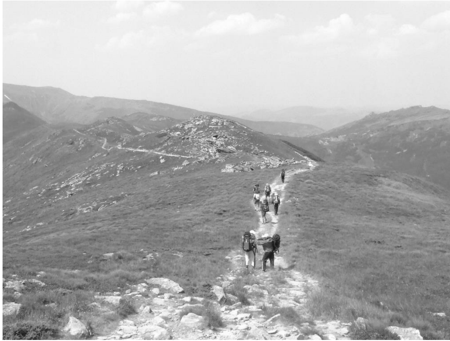
Рис. 9.1. Рух групи туристів гірською стежкою (хребет Черногора)

У горбистих покритих лісами місцевостях лінія руху вибирається вздовж похилих гребенів. На них краще орієнтуватись і легше йти, ніж унизу, у похмурих непривітних ущелинах. На відкритих ділянках трав'янистих схилів, гірських луках, осипах для руху вибирають опуклі форми рельєфу. Тут практично відсутня небезпека каменепадів, зсувів і відкриваються найбільш мальовничі краєвиди.