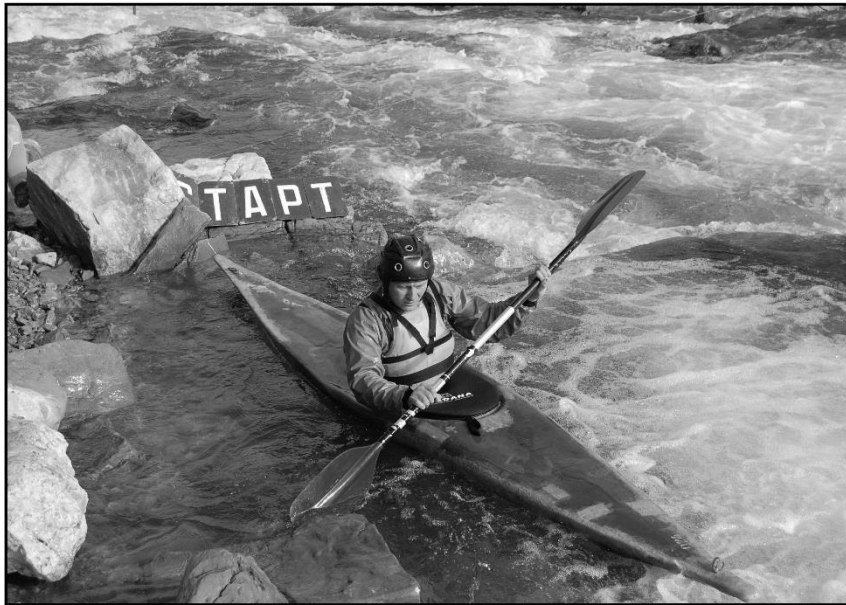
Рис. 8.1. Туристична байдарка.

Човен, рафт. Найпоширеніший плавзасіб з хорошою стійкістю на воді та значною вантажомісткістю. Порівняно із байдаркою та каяком має дещо гірші показники маневреності і значно програє у швидкості. Найчастіше використовується на окремих етапах комбінованих походів, або комерційних екстремальних турах.