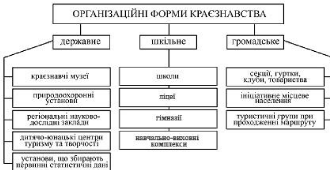
Рис. 1.2. Організаційні форми краєзнавства

Розвиток краєзнавства проявляється у функціонуванні його організаційних форм . Трьома основними формами є: державне, громадське та шкільне краєзнавство (рис 1.2).