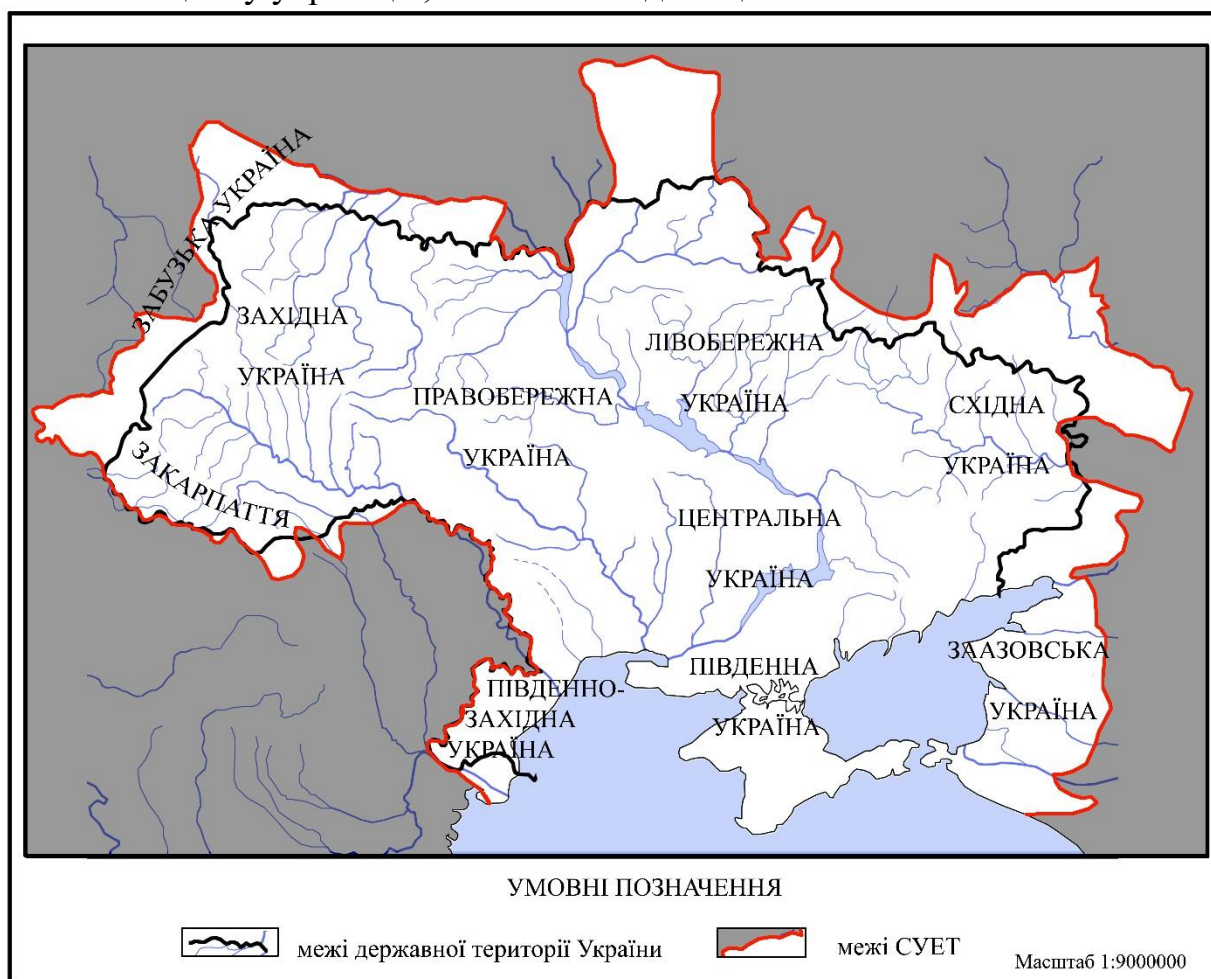
Рис. 2.1. СУЕТ (за С. Рудницьким). Історико-географічні зони.

ІГЗ не має чітких меж. Самі зони виявляються за роллю території у процесі формування українського етносу та його національної ідеї. Хоча виділення ІГЗ і супроводжується виявленням багатьох абстрактних чинників, усе ж це величина об'єктивна, оскільки «є похідною функціонального стану життєвого циклу українців, як етнічної одиниці».