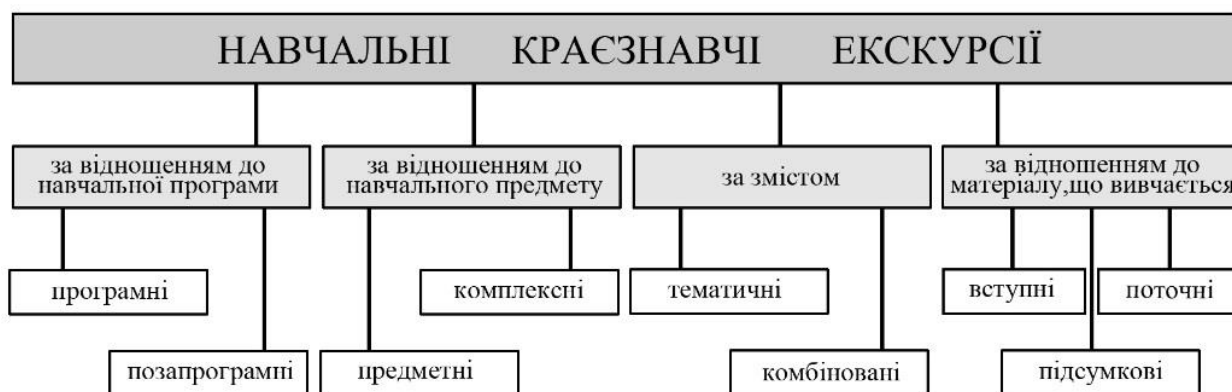
Рис. 4.1. Структура навчальних краєзнавчих екскурсій.

Екскурсії типізують залежно від їх місця в навчальній програмі, предмету, змісту та матеріалу, що вивчається (рис. 4.1).