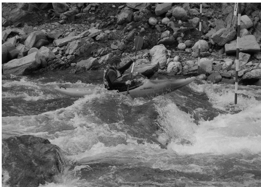
Рис. 7.4. Долання порогів.

- пороги – місця виходу корінних порід, стійких до руслової ерозії. На порогах плавзасіб потрібно скеровувати у місце, де струмені води сходяться, утворюючи правильний трикутник, звернений вершиною вниз (рис. 7.4). Через складні пороги судно проводять страхувальною мотузкою з берега;