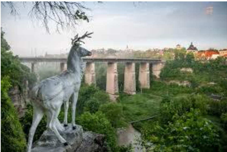
Рис.А.2. Новопланівський міст