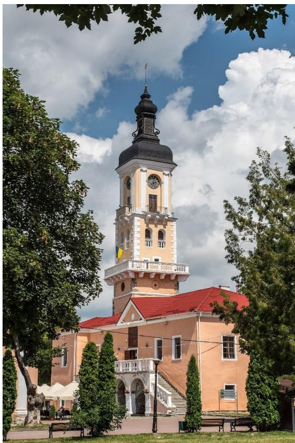
Рис.А.4. Будинок польського магістрату