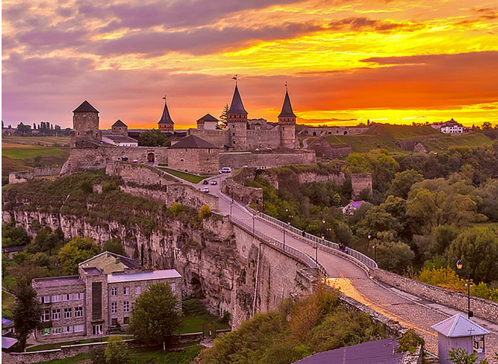
Рис.А.1. Кам'янець-Подільська фортеця