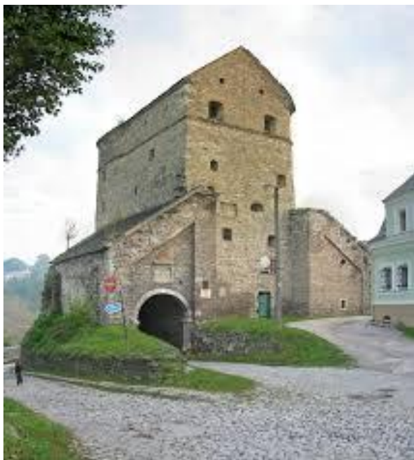
Рис.А.3. Вітряна брама