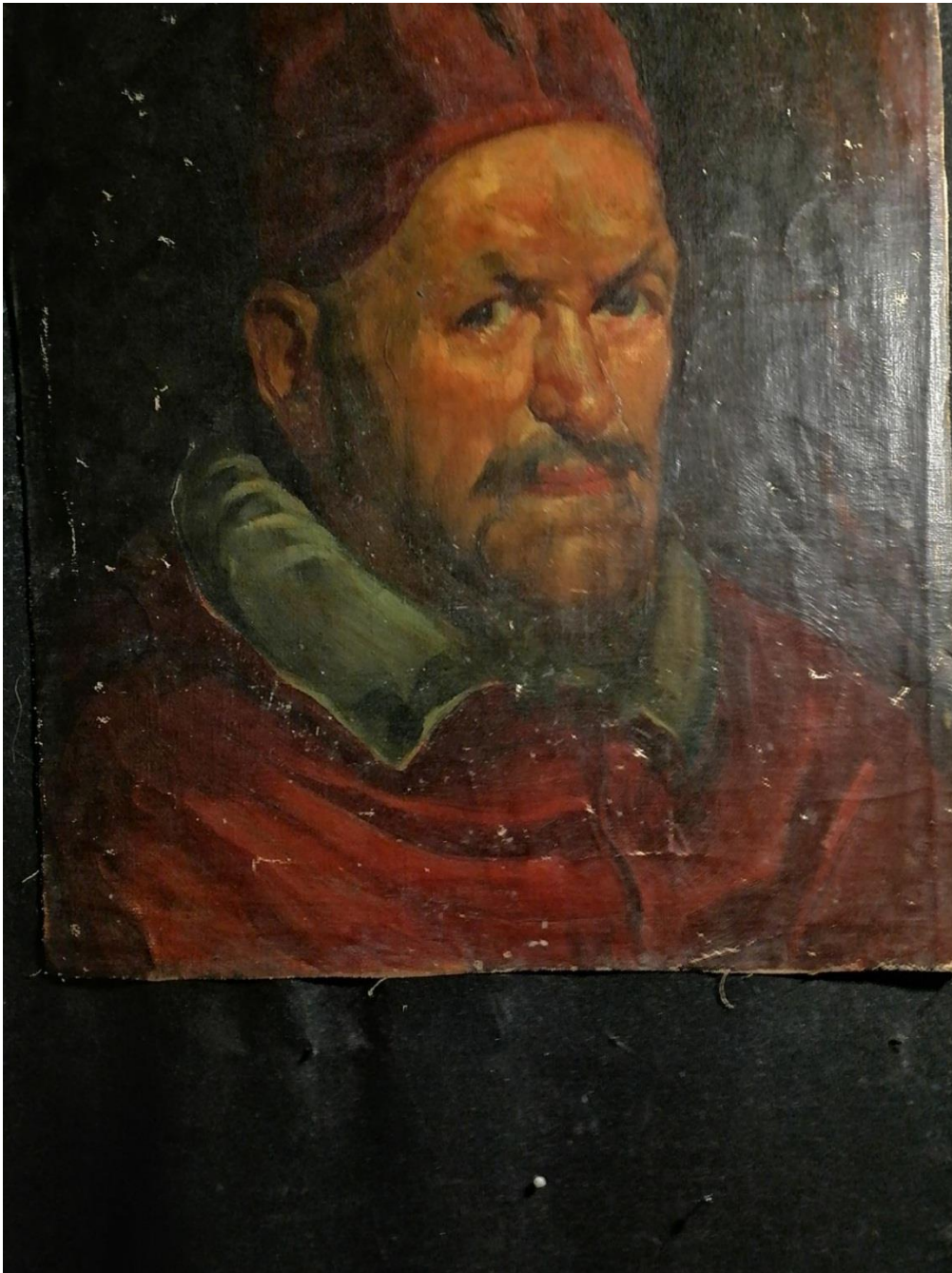
Д. Жудін. Портрет чоловіка в середньовічному костюмі.