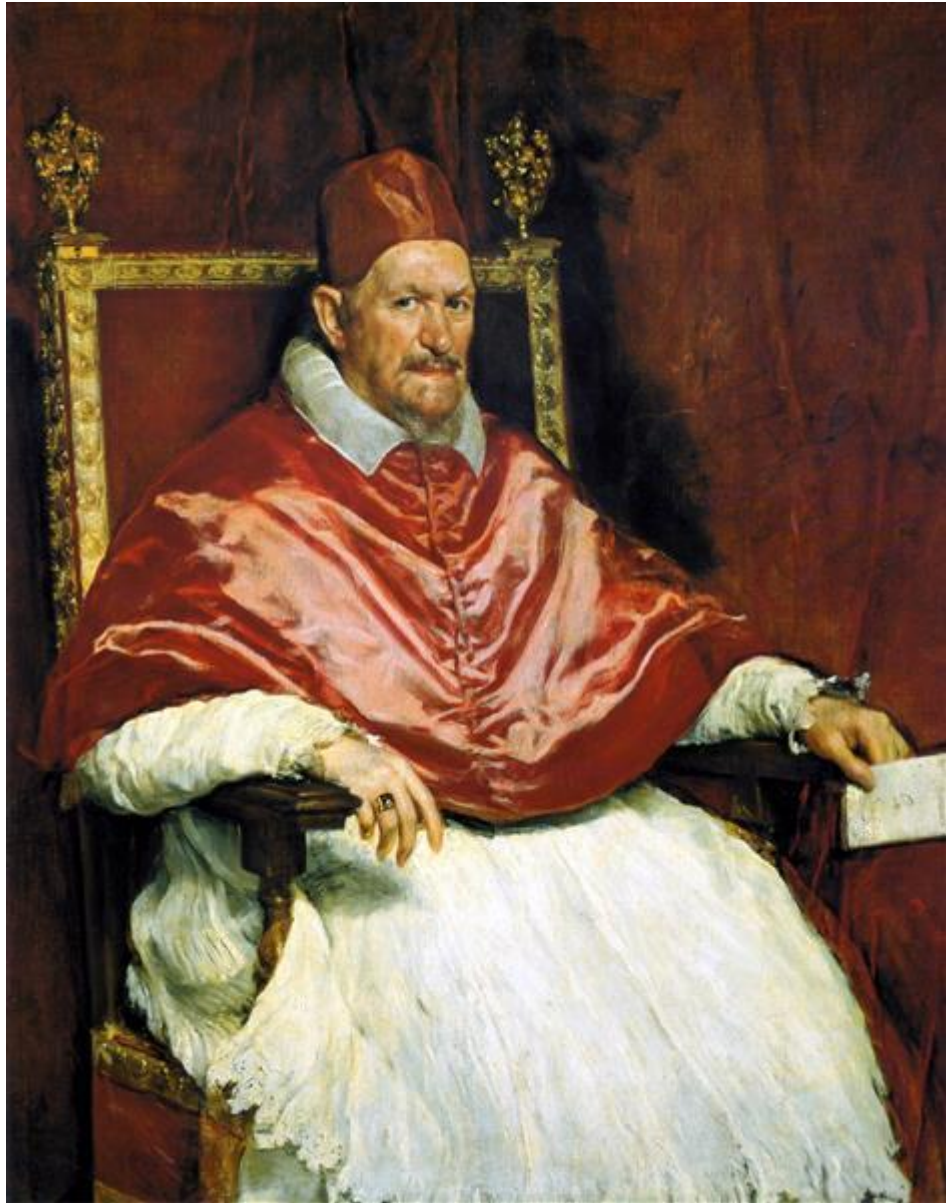
Дієго Веласкес. Портрет Папи Інокентія Х