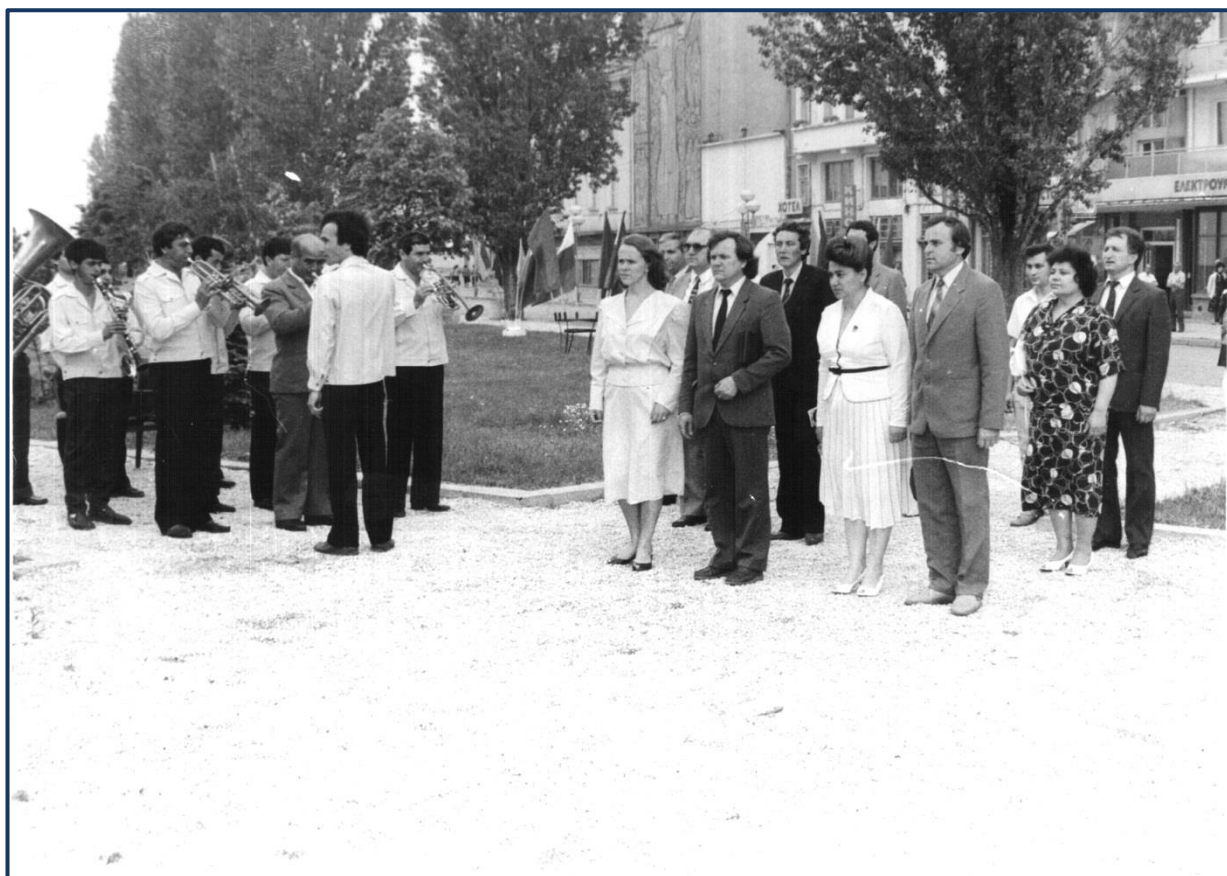
У складі делегації м. Кам'яця-Подільського у Болгарії. (1989р.)