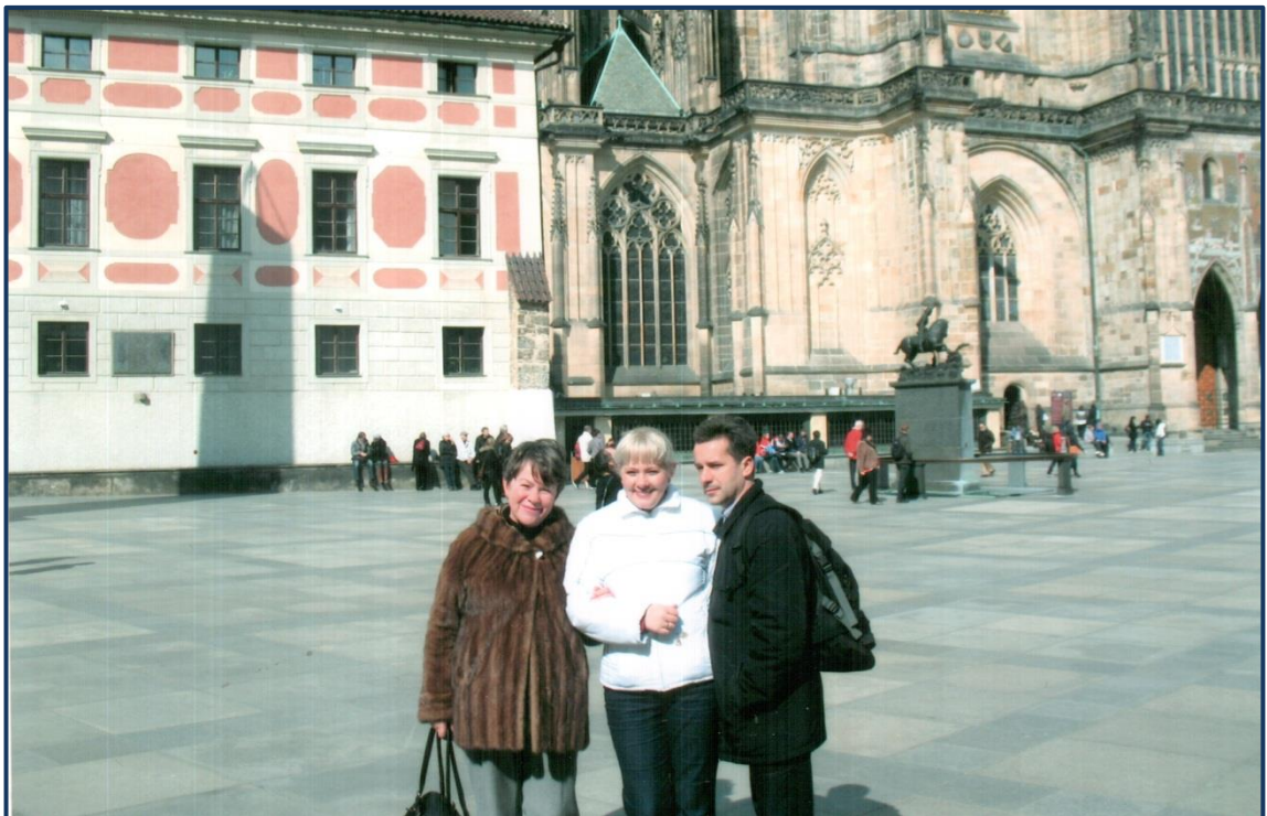
В Празі. З дочкою і зятем.