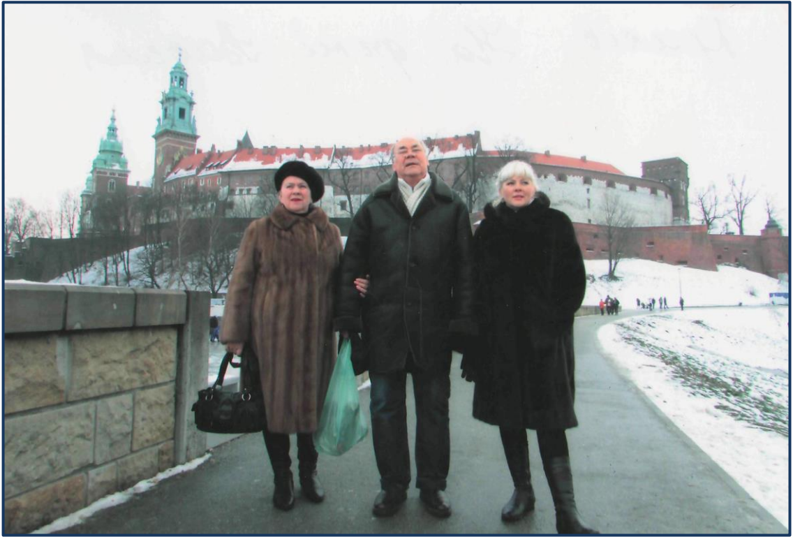
Краків. На фоні Вавеля.