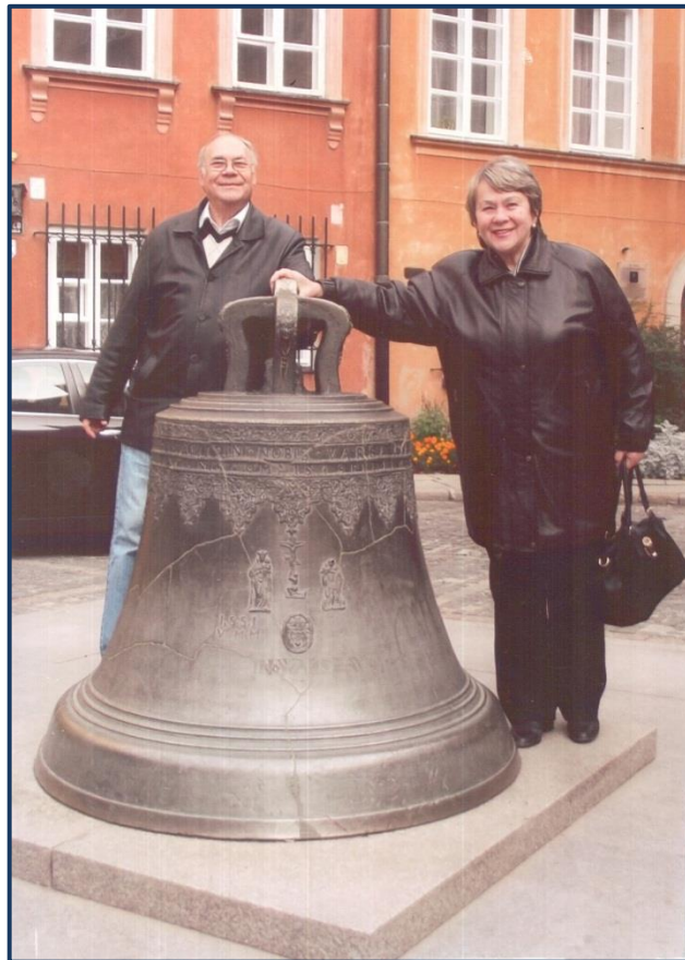
Дзвін кохання у Варшаві.