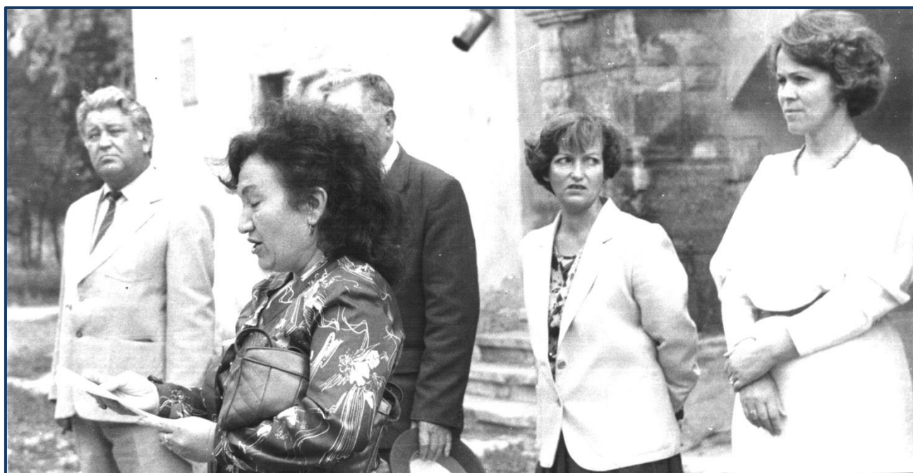
Відкриття болгарської виставки в музеї (5.09.1987р.)