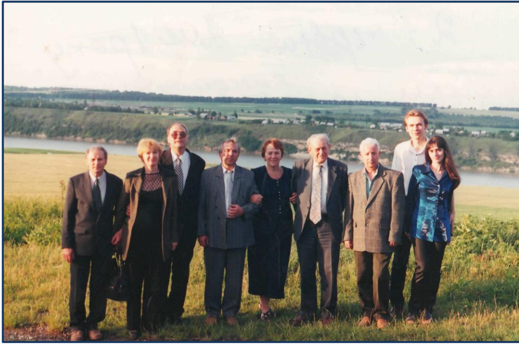
Після захисту кандидатської дисертації з групою підтримки (27.06.2001 р.)