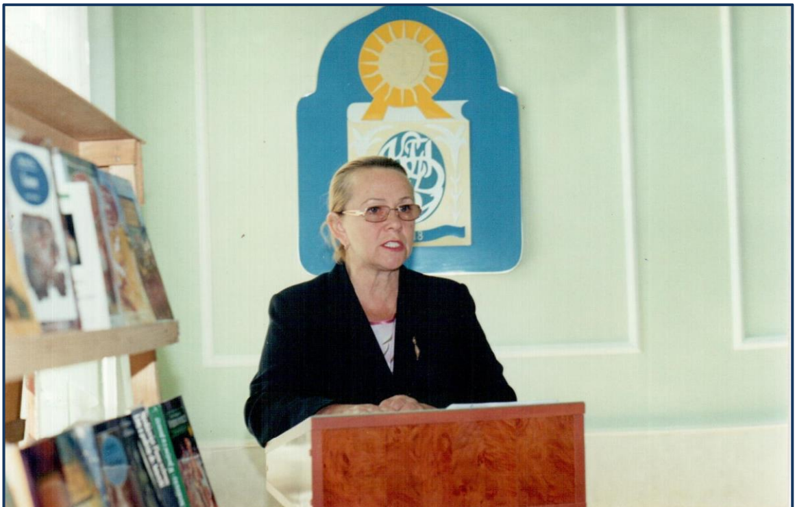
Виступ на міжнародній конференції.