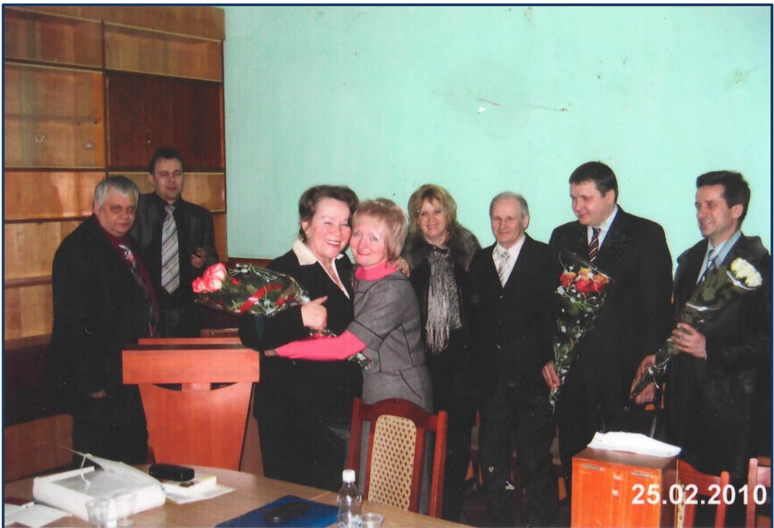
Успішно захищена докторська дисертація.