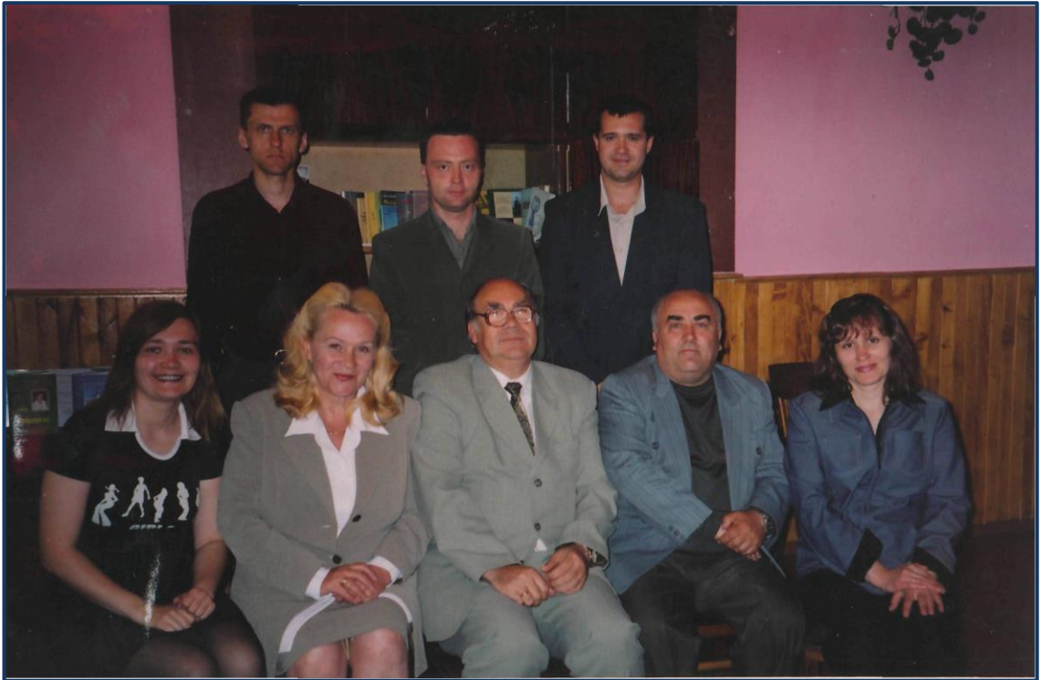
Центр дослідження Поділля.