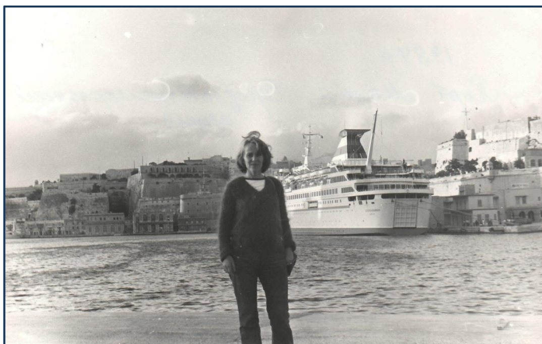
Порт Мальти. Середземноморський круїз. (1984 р.)