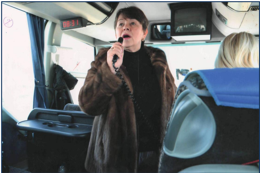
Навчальна екскурсія для студентів.