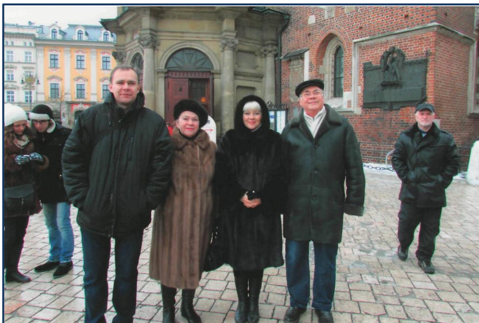
З родиною у Кракові.