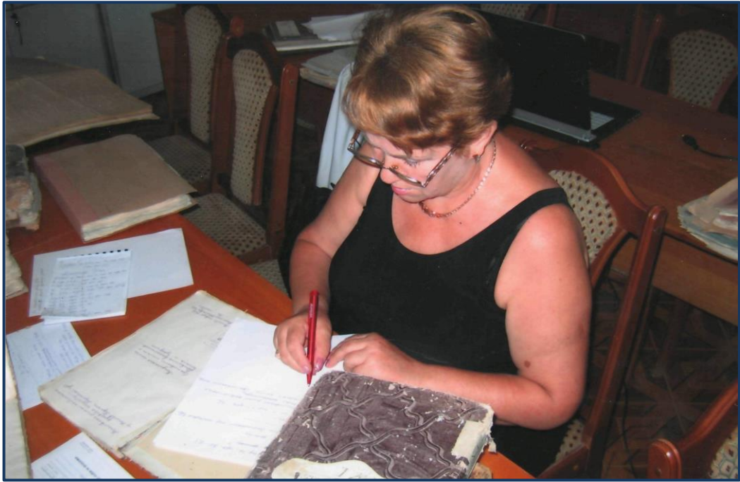
У Вінницькому державному архіві.