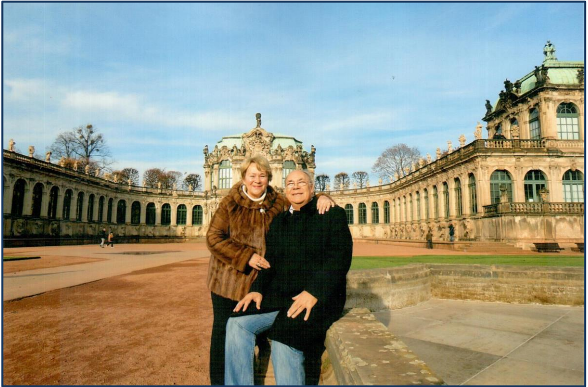
Дрезденська картинна галерея.(17.11.2014р.)