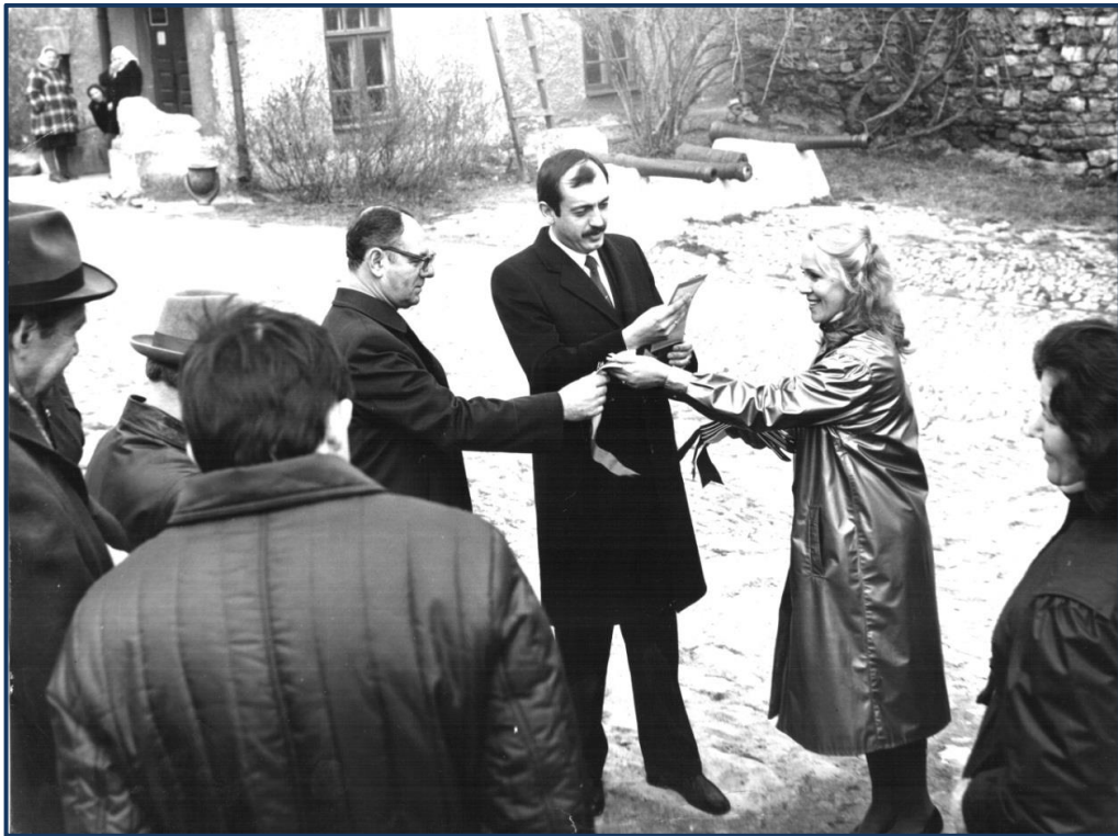
Екскурсія в Кам'янець-Подільській фортеці.