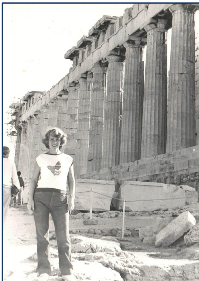
Афіни: Парфенон (1984р.)