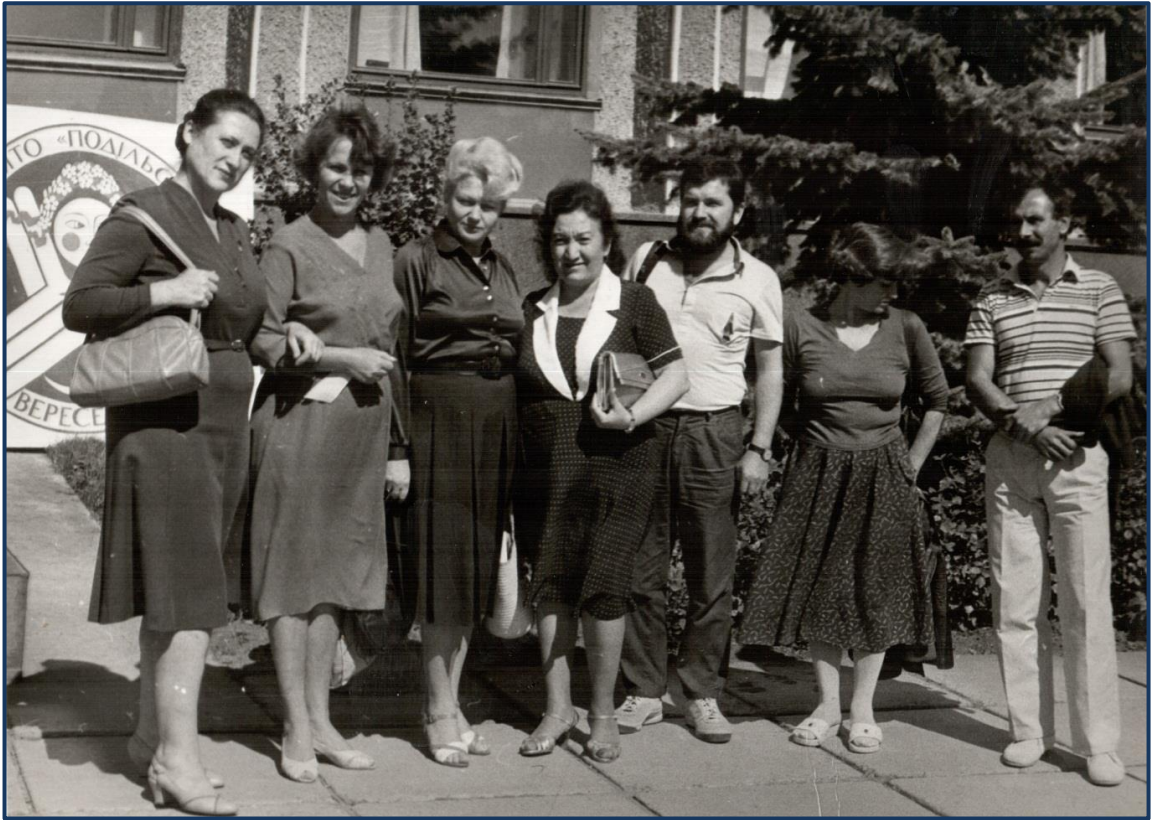
Болгарська делегація в Кам'яниці–Подільському (1987р.)