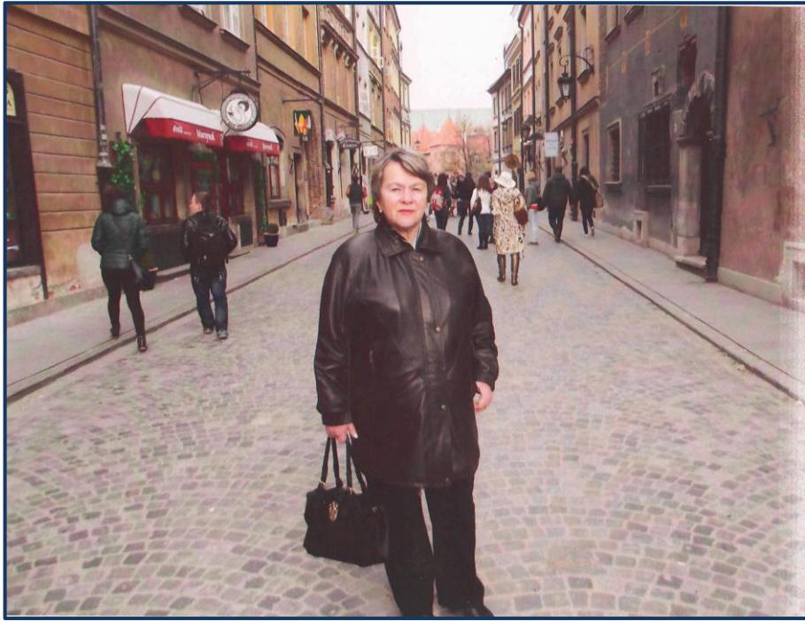
На вуличці Варшави.