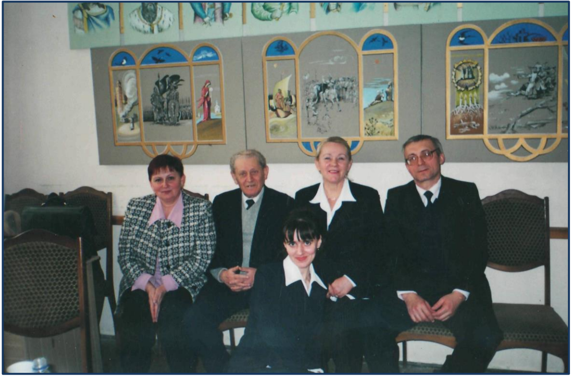
Після захисту кандидатської дисертації сина.