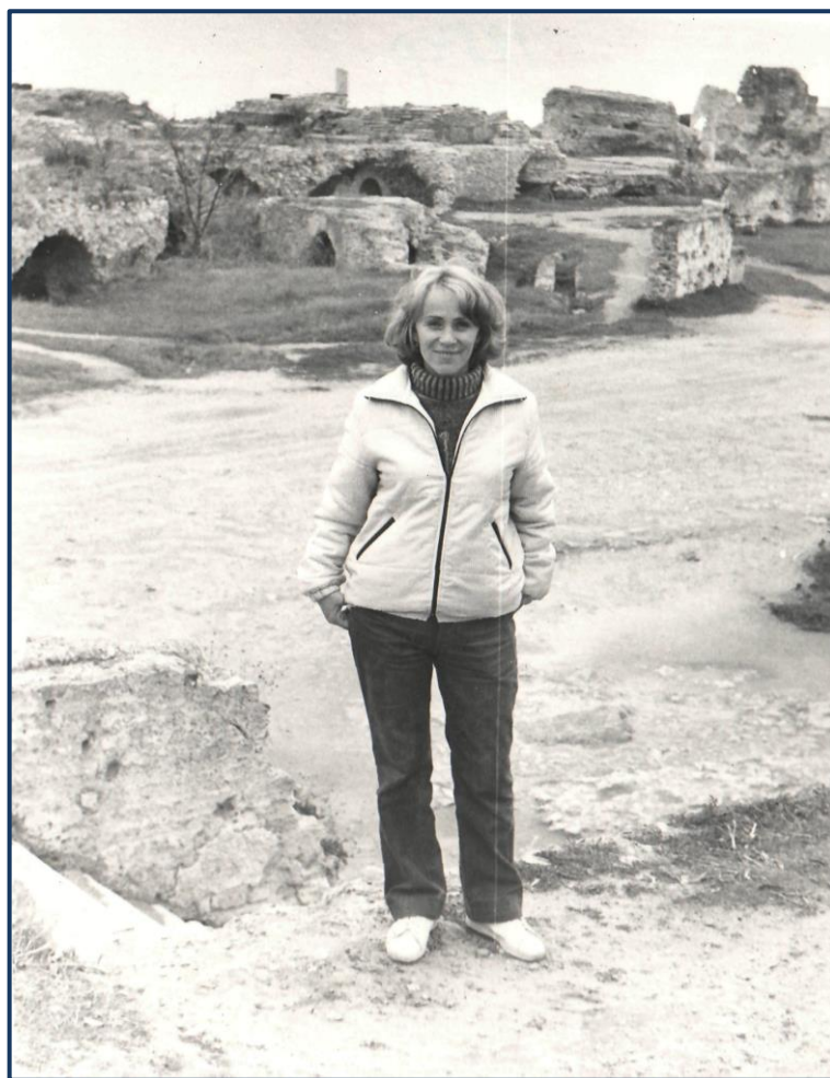
Залишки Карфагену (1984р.)