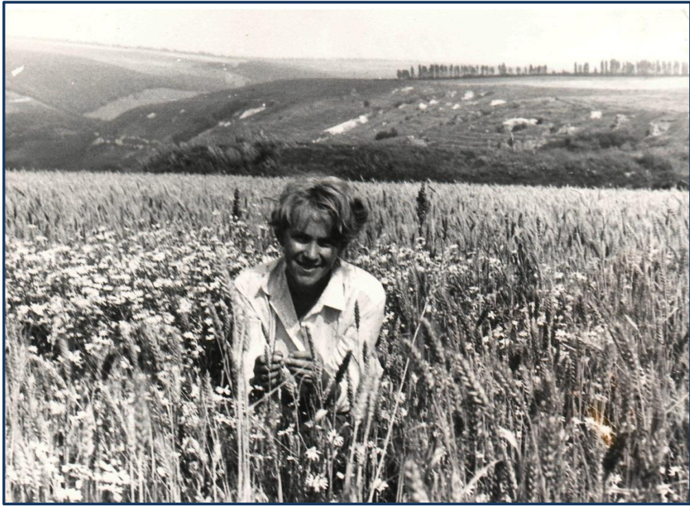
Археологічна експедиція в с. Глибівка Ново-Ушицького району (1982р.)