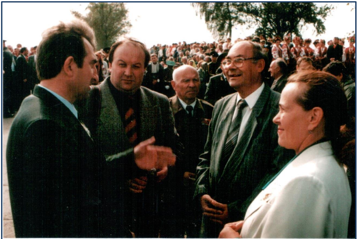
Свято козацької слави у Пиляві.