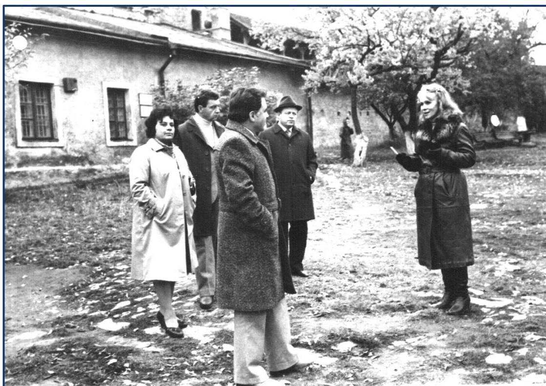
Екскурсія з болгарами (1990р.)