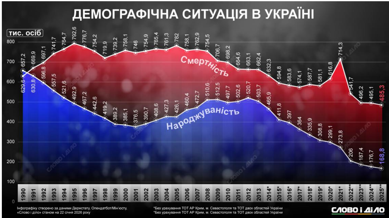
Рис.3.1 Народжуваність і смертність в Україні за 35 років [1].

До завдання 1: «Характеристика основних чинників народжуваності».