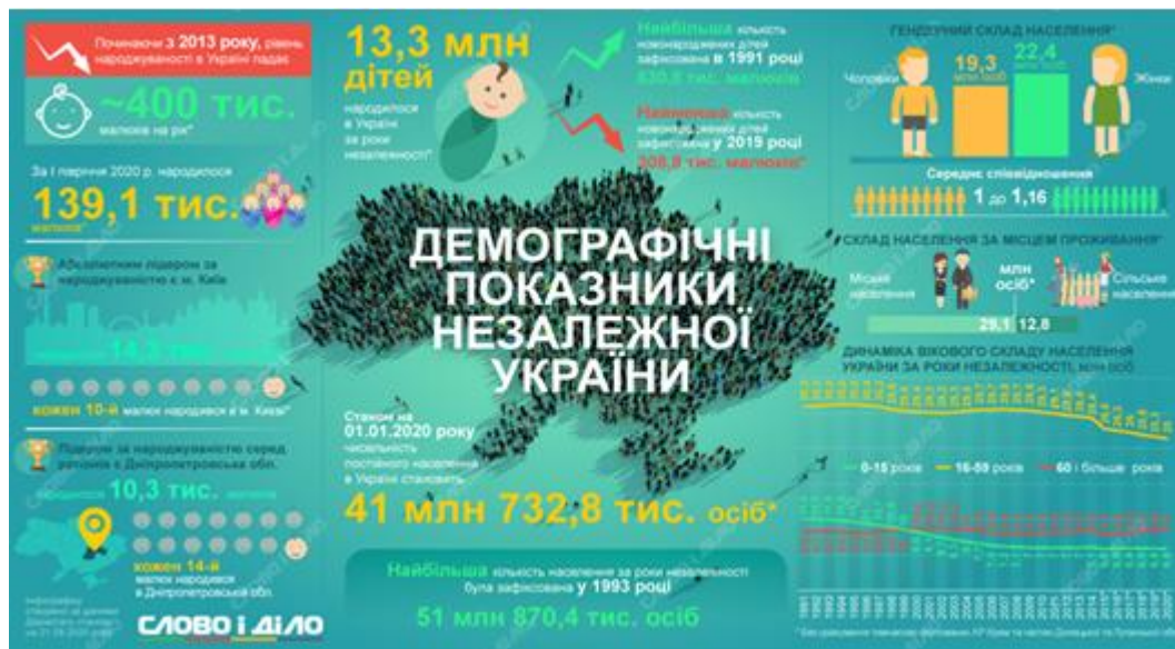
Рис. 3.2 Демографічна ситуація в Україні в період незалежності [51].