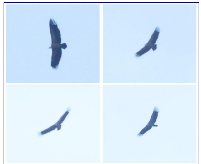
Рис. 2. Сип білоголовий в околицях с. Баговиця Fig. 2. Griffon Vulture in the fence surrounding villages of Bagovica

A supervision Griffon Vulture Gyps fulvus Hablizl in Podilya. Tarasenko M.O. At October, 13 2013 in the fence surrounding villages of Bagovica in the Kam'yanets-Podilskyi district of the Hmelnytsky area on migration the adult individual Griffon Vulture.