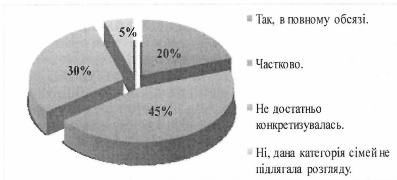
Рис. 2. Надання студентам-магістрам конкретної інформації по роботі з сім'ями, які перебувають в СЖО.

Результати дослідження дають змогу з'ясувати, факт надання студентам вичерпної інформації по специфіці роботи з сім'ями, які перебувають в складних життєвих обставинах. Отже, 45% (9 осіб) респондентів стверджують, що дана інформація надавалася частково. 30% (6 осіб) опитаних вказують на недостатність інформації, так як сім'ї з СЖО розглядалися в загальному контексті і робота з ними не достатньо конкретизувалась. 20% (4 особи) студентів запевняють, що інформація по здійсненню роботи з даною групою клієнтів надавалася в повному обсязі і 5% (1 особа) опитаних наголошують на тому, що дана категорія сімей не підлягала розгляду. Тому зі слів опитаних можна стверджувати, що висвітлення інформації по специфіці роботи з сім'ями, які перебувають в СЖО для студентів-магістрантів здійснювалося на середньому рівні, адже студенти частково ознайомлювалися з деталями роботи по даній категорії сімей, так як робота з ними не конкретизувалась, а просто розглядалася в загальному контексті.