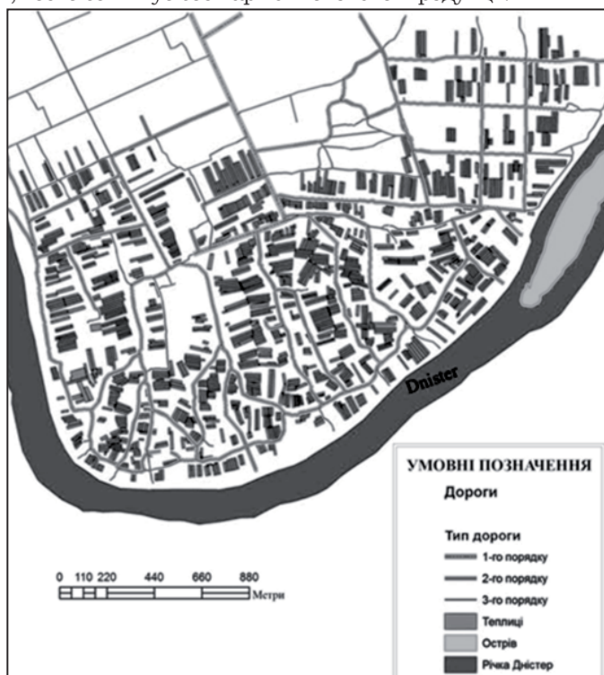
Рис. 1. Просторова структура тепличного господарства с. Горошова

Причин, що стримують збільшення обсягів виробництва овочевої продукції закритого ґрунту в с. Горошова багато, але основна – це відсутність прямої фінансової допомоги галузі, а також державної підтримки за рахунок економічних важелів: пільгового кредитування й оподаткування, прямої підтримки виробників, відшкодування витрат для здешевлення матеріально-технічних ресурсів. Відповідно господарювання селян характеризується низьким рівнем агротехнологій при виробництві продукції, використанням застарілої техніки, що не дозволяє застосовувати енергозберігаючі технології вирощування, тобто збільшує собівартість овочевої продукції.