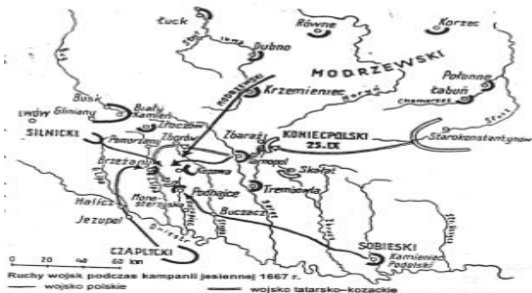
Рухи військ під час Підгайцької кампанії 1667 р.