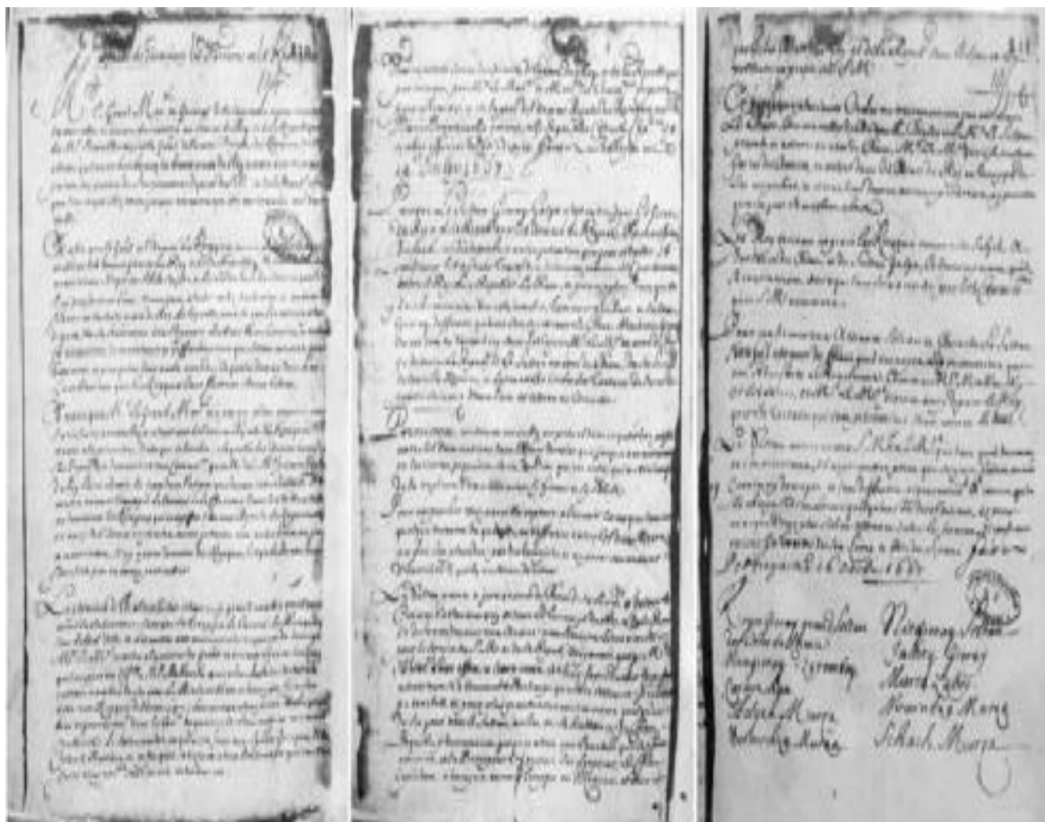
Колодницький С. Битва гетьмана Петра Дорошенка під Підгайцями 1667 року: передумови хід та наслідки // Гетьман Петро Дорошенко та його доба в Україні / Упорядник Є. М. Луняк ; Музей гетьманства. – Ніжин : НДУ ім. М. Гоголя, 2015. – С. 123.