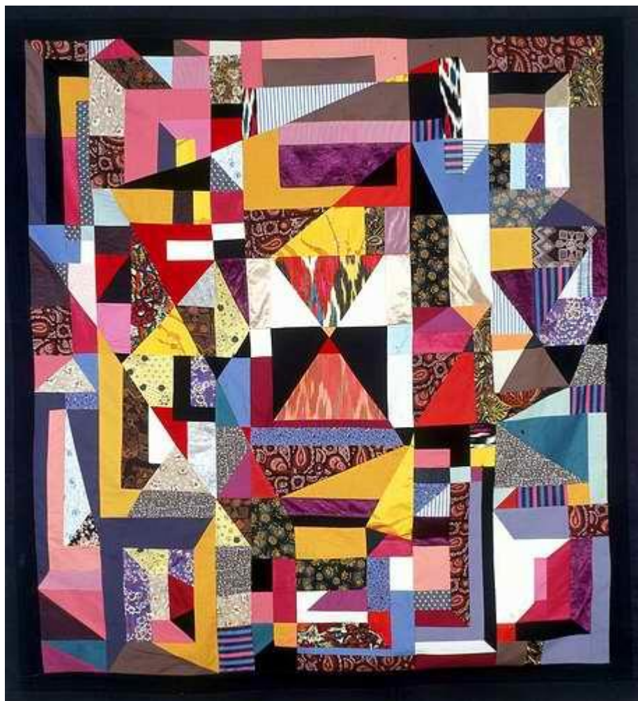
Рис. В 1. Декоративне панно «Геометрія часу»