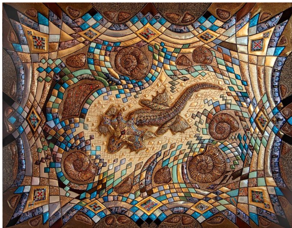
Рис. В 3. Декоративне панно