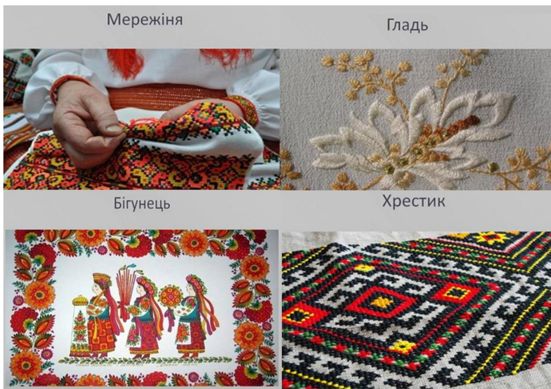
Рис. Б 1. Українська вишивка