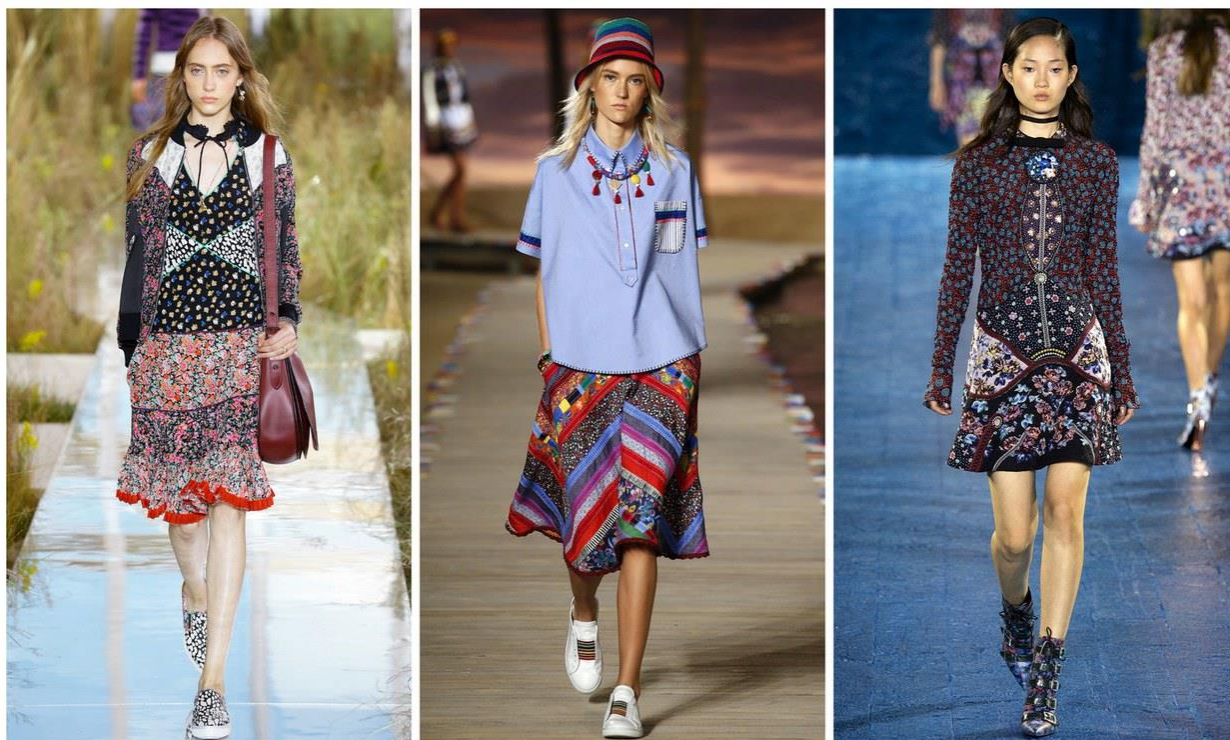
Рис. Д 4. Стиль печворк на подіумі