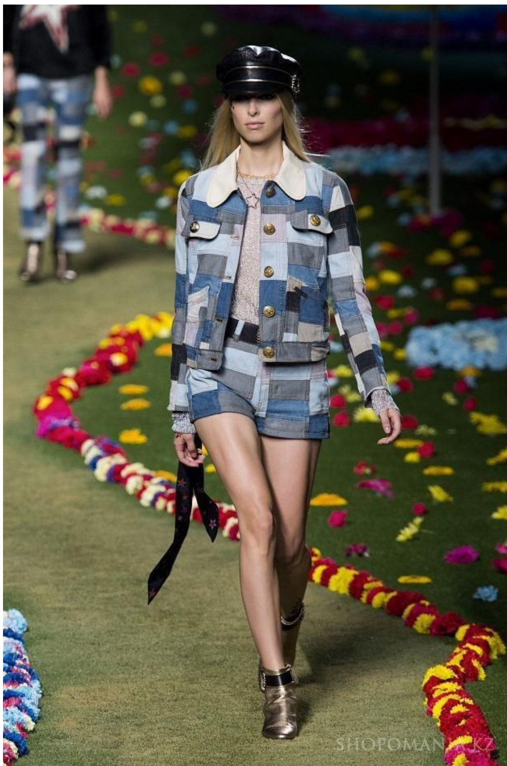
Рис. Д 1. Печворк в одязі з колекції Tommy Hilfiger