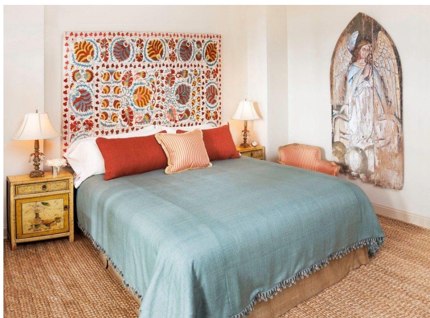
Рис. Г 1. Декоративне панно в інтер'єрі