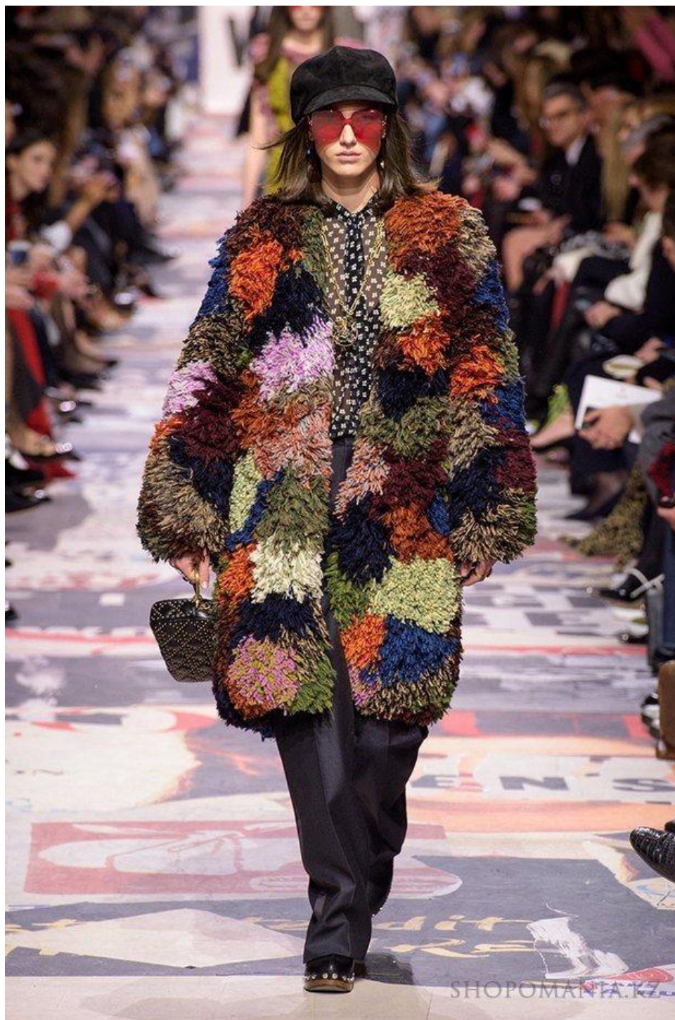
Рис. Д 2. Печворк шуби з колекції Fenfi, Valentono, Saint Laurent