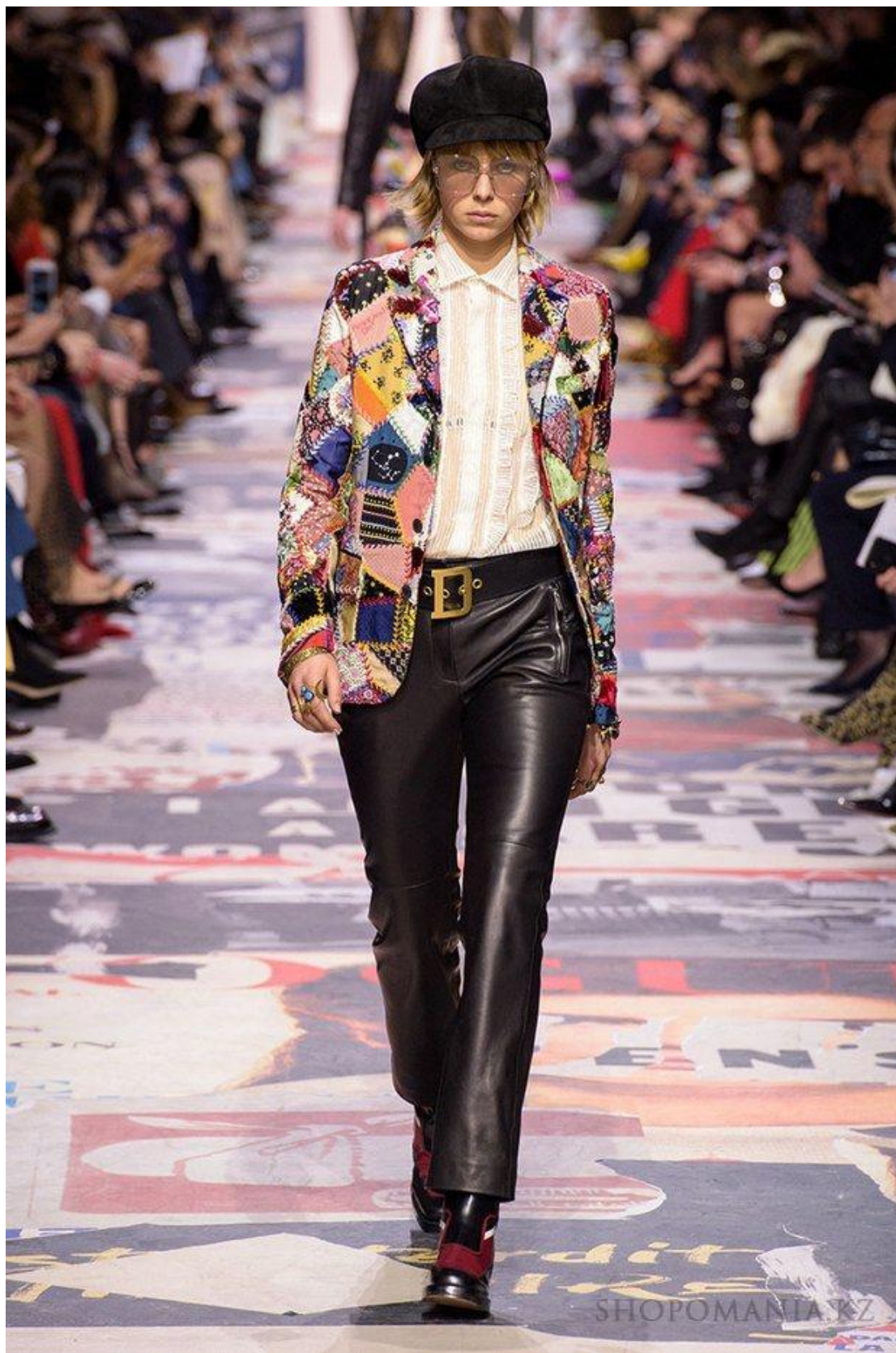
Рис. Д 3. Жакеты, блейзеры (печворк)