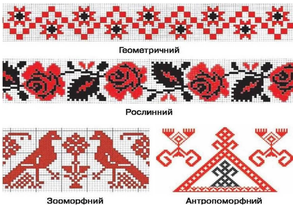
Рис. Б 2. Види орнаменту вишивки