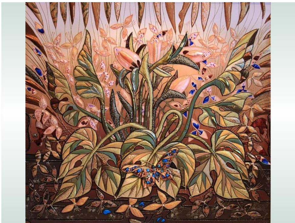
Рис. В 2. Декоративне панно