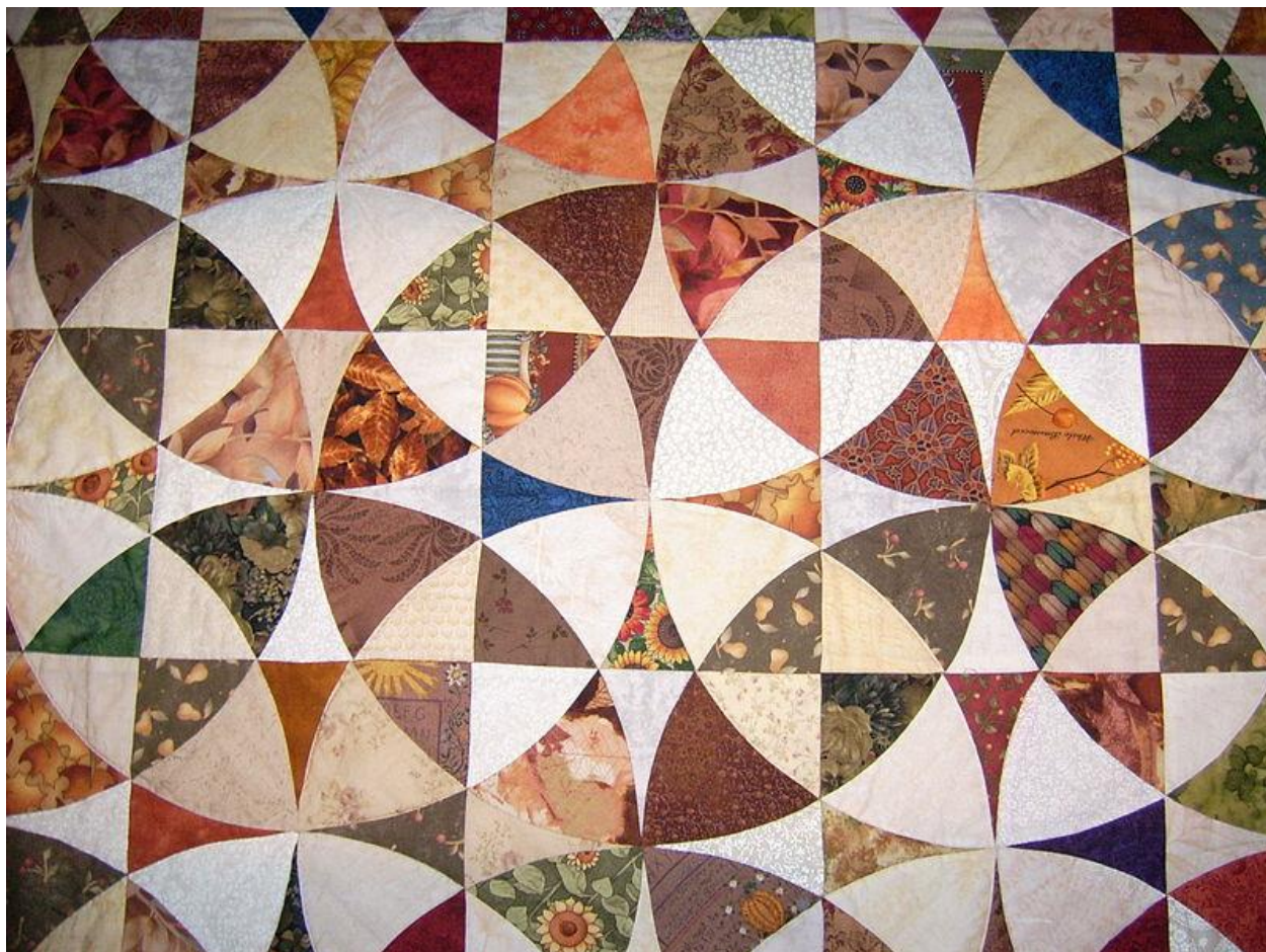
Рис. А 1. Клаптикове полотно, зібране з деталей із закругленими сполучними швами