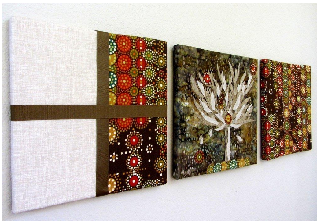
Рис. Г 2. Декоративне панно