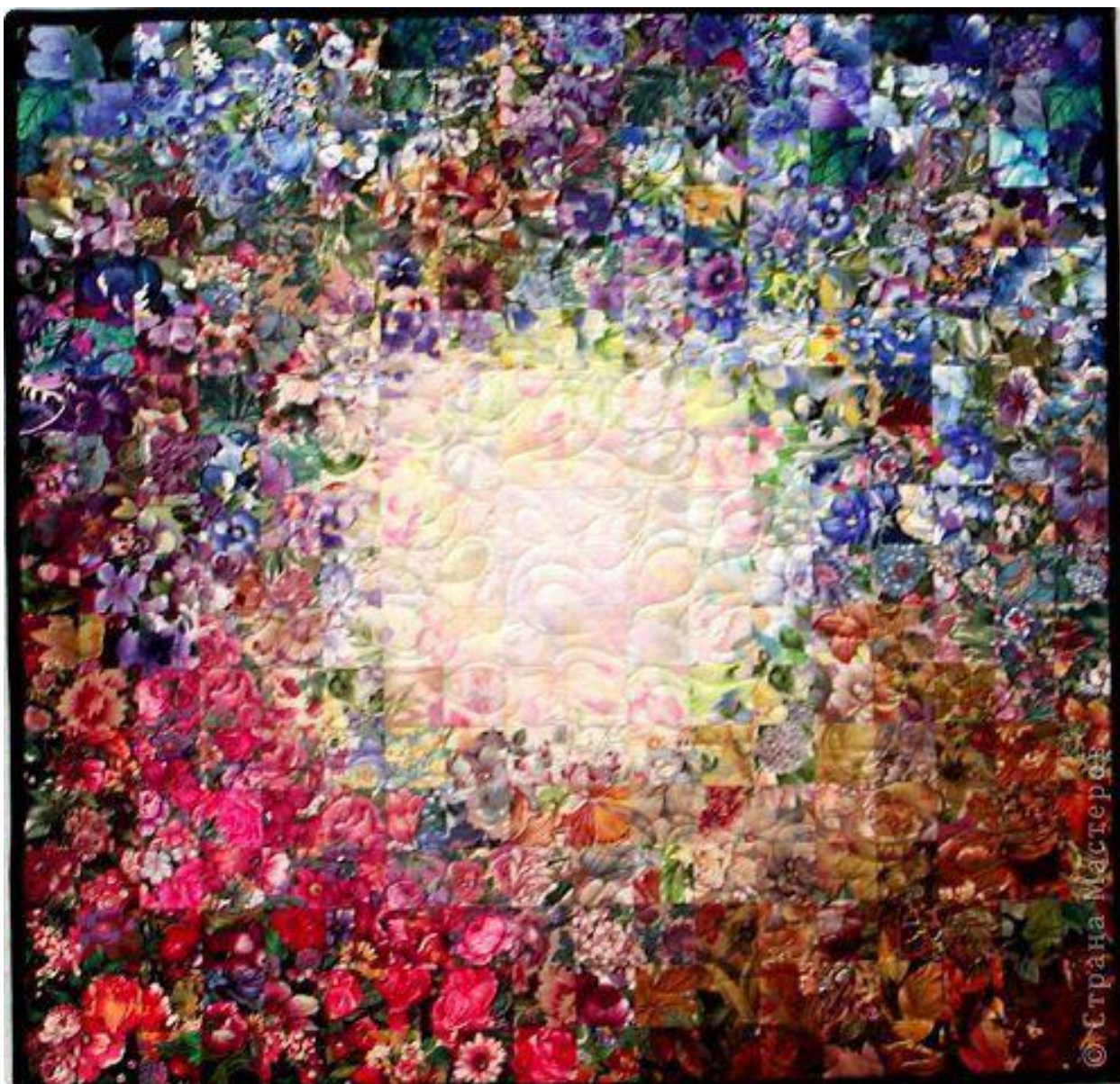
Рис. А 3. Техніка «Акварель» – клаптиків Шиття – печворк і квилтинг, Крезі-