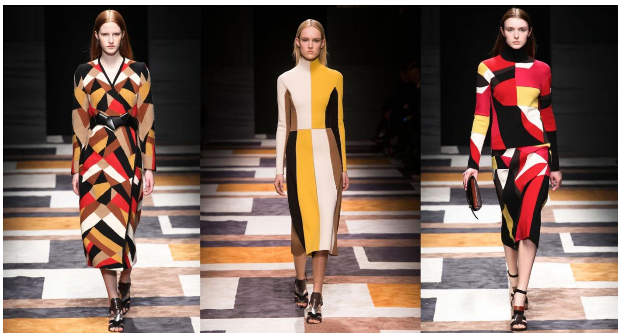
Рис. Д 5. Колекція для жінок Salvatore Ferragamo