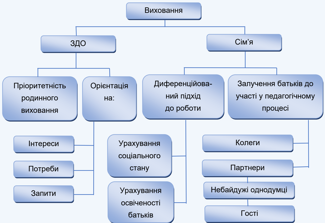
Рис. 1. Сучасні підходи до співпраці ЗДО та сім'ї

Аналізуючи схему, бачимо значимість взаємозв'язку закладу дошкільної освіти з сім'єю. Потрібно наголосити на тому, що відповідно до Положення про ЗДО учасниками освітньо-виховного процесу є не лише педагогічні та медичні працівники, а також батьки дітей. Адже сім'я – найперший і найважливіший соціальний інститут виховання. Їй належить пріоритет у становленні особистості дитини, вона має максимальні можливості для набуття малюком знань, умінь та навичок, необхідних у подальшому житті.