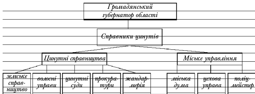
Схема 1 АДМІНІСТРАТИВНО-ПОЛІЦЕЙСЬКА ВЛАДА В ПОВІТАХ ПІВНІЧНОЇ БЕССАРАБІЇ (1813–1827 рр.)

Автономію Бессарабії суттєво обмежило нове положення 1828 р. про адміністративний устрій області [9, 133]. Замість обласного уряду утворено Обласне правління, а Верховна рада області замінена Обласною радою, яка ставала дорадчим органом. “Положення” 1828 р. відмінило виборність системи справництва. Справники та інші повітові чиновники призначалися генерал-губернатором [7, 151].