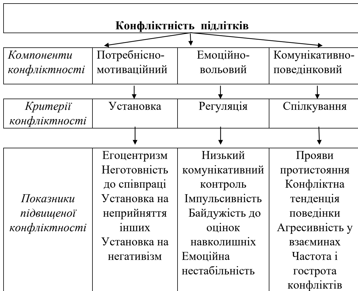
Рис. 1. Психологічна структура конфліктності підлітків

Показниками потребнісно-мотиваційного компоненту слугують егоцентризм, готовність до співпраці, установка на прийняття інших, установка на негативізм.