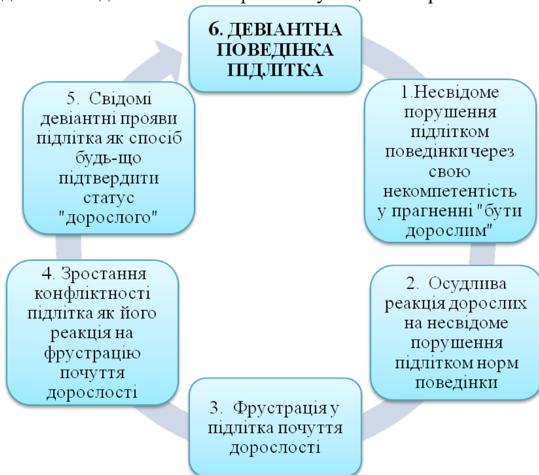
Рис. 2. Роль конфліктності у формуванні девіантної поведінки підлітків

числа провідних причин девіантної поведінки підлітка включають несприятливі умови з боку сім'ї, альтернативну поведінку його батьків та найближчого оточення. Наприклад, часті сварки, скандали батьків, фізичні покарання підлітків, природно, призводять до руйнування гальмівних процесів, до виховання запальності, підвищеної збудливості, нестриманості. Найчастіше зустрічаються наступні негативні психічні стани: озлоблення, незадоволеність, ворожість, страх, недовіра, самотність, байдужість. Кожен з цих психічних станів, поєднуючись з несприятливими внутрішніми передумовами (підвищена збудливість, прогалини в розумовому розвитку, як наслідок, низька успішність, слабка сила волі тощо) викликає зростання конфліктності з подальшим відчуженням і опором підлітка педагогічним впливам, посиленням негативних соціальних впливів. Цілковитим погоджуючись з цими авторами, ми хочемо підкреслити, що наявність таких невдалих зразків у сімейному середовищі лише посилює некомпетентність підлітка у життєвих ситуаціях, його неспроможність вирішити свої досить складні особистісні проблеми у соціально прийнятний спосіб.