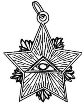
Знак ложі Полум'яної Зорі