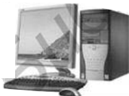
Der Computer: im 20. Jahrhundert in Frankreich