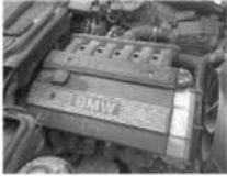
Der Benzinmotor: 1864 in Deutschland