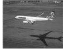
Das Flugzeug: 1891 in Deutschland