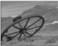
Das Rad: vor 4000 Jahren in Mesopotamien