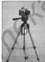
Der Fotoapparat: 1837 in Frankreich