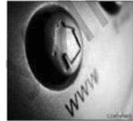
Das Internet: im 20. Jahrhundert