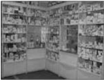
Die Medikamente: seit Jahrtausenden überall