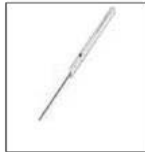
Der Laser: im 20. Jahrhundert in der UdSSR