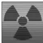
Die Atomenergie: im 20. Jahrhundert in Frankreich