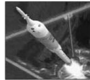
Die Rakete: vor 900 Jahren in China