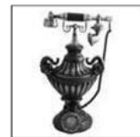
Das Telefon: 1876 in den USA