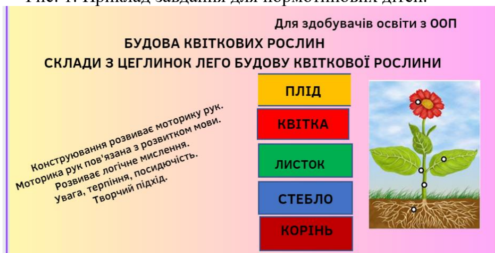
Рис. 2. Приклад адаптованого завдання для дітей з ООП.

Використовуючи даний приклад, студентам пропонується розробити завдання для інших тем.