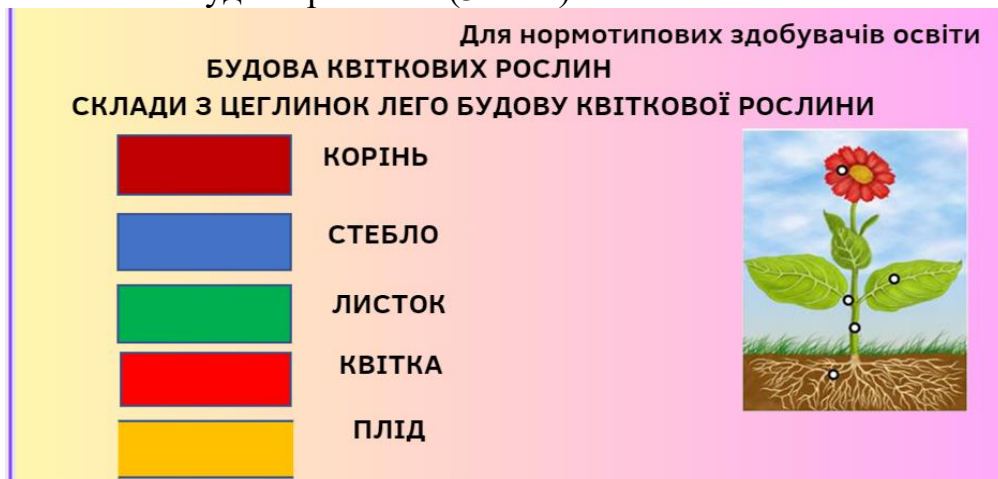
Рис. 1. Приклад завдання для нормотипових дітей.

У формуванні природознавчих понять в початковій школі використовують «цеглинки lego». Пропонуємо використання адаптованих навчальних завдань з теми: «Вивчення будови рослин» (3 клас).