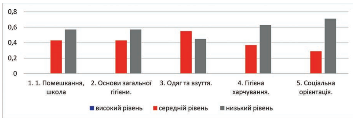
Рис. 2. Рівні сформованості навичок самообслуговування

Висновки. Вивчення стану проблеми у практиці роботи спеціальної школи дозволяє зробити висновок, що всі завдання роботи по формуванню навичок самообслуговування розв'язуються ефективніше у спеціально організованому педагогічному просторі за умови дотримання певних умов. Це дозволить учням якомога якісніше засвоїти