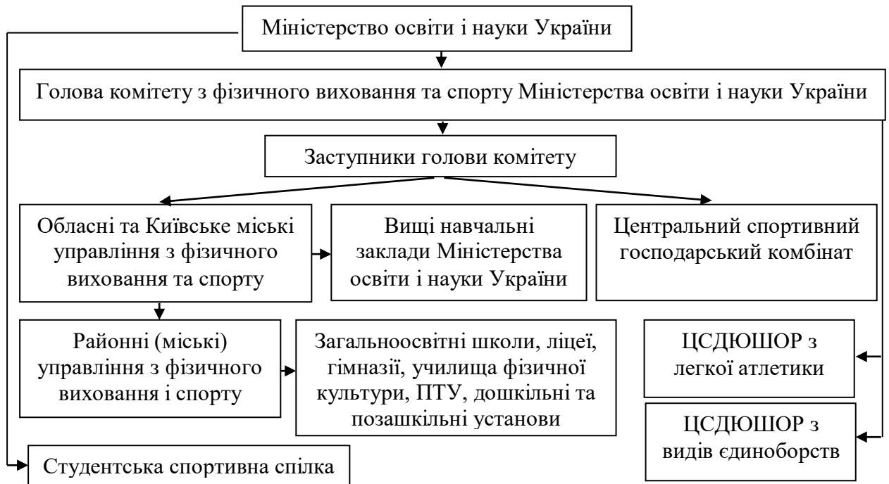
Рис. 3.2 Структура управління процесом фізичного виховання та спорту у вищих навчальних закладах Міністерства освіти і науки України

фізичної культури і спорту. Завданням цього Комітету є вдосконалення структури та організації роботи з фізичного виховання та спорту в навчальних закладах України, управління й координації фізкультурно-спортивної роботи серед молоді [36]. На рисунку 3 подано структуру управління процесом фізичного виховання та спорту у вищих навчальних закладах Міністерства освіти і науки України станом на 2001 рік.