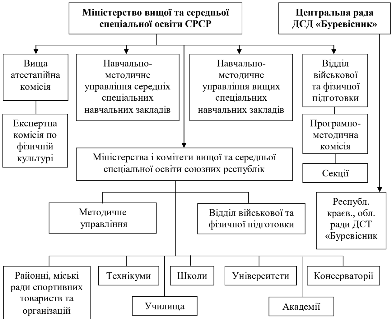
Рис. 1.1 Схема організації фізичного виховання студентської молоді в системі Міністерства вищої та середньої освіти СРСР на 1961 р.

навчать них закладів навчальну, оздоровчу, фізкультурно-масову та спортивну роботу. На рис.1. подано структурну схему організації фізичного виховання студентської молоді в системі Міністерства вищої та середньої освіти СРСР.