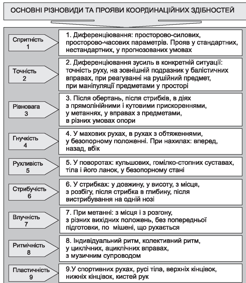
Рис. 1.2 Основні різновиди та прояви координаційних здібностей (за Є. Назаренко) [41]

Кожна з рухових координації має власну структуру. Відображаючи різні сторони рухової діяльності завдяки структурній впорядкованості, вони є цілісною системою і при певній специфіці мають загальні ознаки (рис. 1.2).