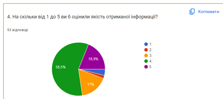
Рис. 3.4. Оцінка задоволеності отриманою інформацією

Також опитані переважно задоволені отриманою інформацією. Оцінювання проводилось за 5 бальною шкалою. Де «5» повністю задоволені, а «1» - зовсім незадоволені. З опитаних найпоширенішою була оцінка в «4 бали» – її обрало 58,5% (31 особа) респондентів. Найменш популярною була відповідь «2» - 1,9%. Її обрала лише одна особа. Також, 18,8% (10 осіб) обрала найвищий бал – «5». 17% (9 осіб) обрала оцінку «3». І 2 особи, або 3,8% обрала оцінку «1» (див.рис.3.4)