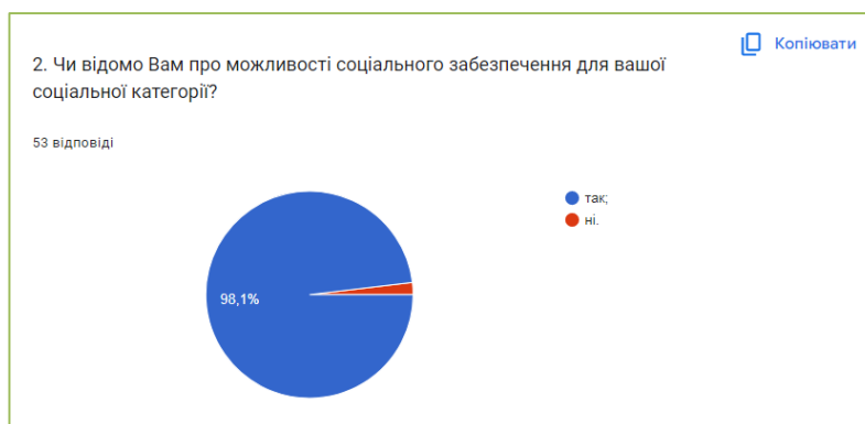
Рис. 3.2. Характеристика дослідження доступності інформації про можливості соціального забезпечення для її соціальної категорії.

Також більшість респондентів вказали, що їм відомо про можливості соціального забезпечення для їх соціальної категорії. «Так» - відповіли 98,1% і «ні» - 1, 9%. Або з опитаних 52 особи відповіли «так» і одна –« ні». Для зручності результати подаємо у вигляді рис.3.2.