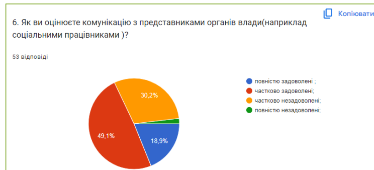
Рис. 3.6. Оцінка комунікації з представниками органів влади

незадоволених – 30,2% (16 осіб) і 1,9% (1 особа) повністю незадоволена (рис.3.6.)