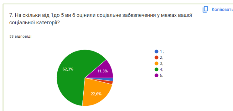
Рис. 3.7. Загальна оцінки соціального забезпечення у межах певної соціальної категорії

Щодо загальної оцінки соціального забезпечення у межах певної соціальної категорії, респонденти переважно задоволені. На «5» її оцінило 11,3% (6 осіб), 62,3% (33 особи) обрало варіант – «4», 22,6% (12 осіб) обрали варіант «3». І відповідно «1» та «2» бали обрало по 1,9% (1 особа). Для зручності характеристику загальної оцінки соціального забезпечення у межах певної соціальної категорії подаємо у вигляді рис.3.7.