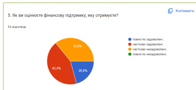
Рис. 3.5. Оцінки фінансової підтримки

На рахунок оцінки фінансової підтримки, більшість респондентів частково задоволені. Такий варіант обрала 43,4% (23 особи). Повністю задоволені – 20,8% (11 осіб) і частково незадоволені – 35,8% (19 осіб). Повністю незадоволених серед опитаних не було (рис.3.5.)