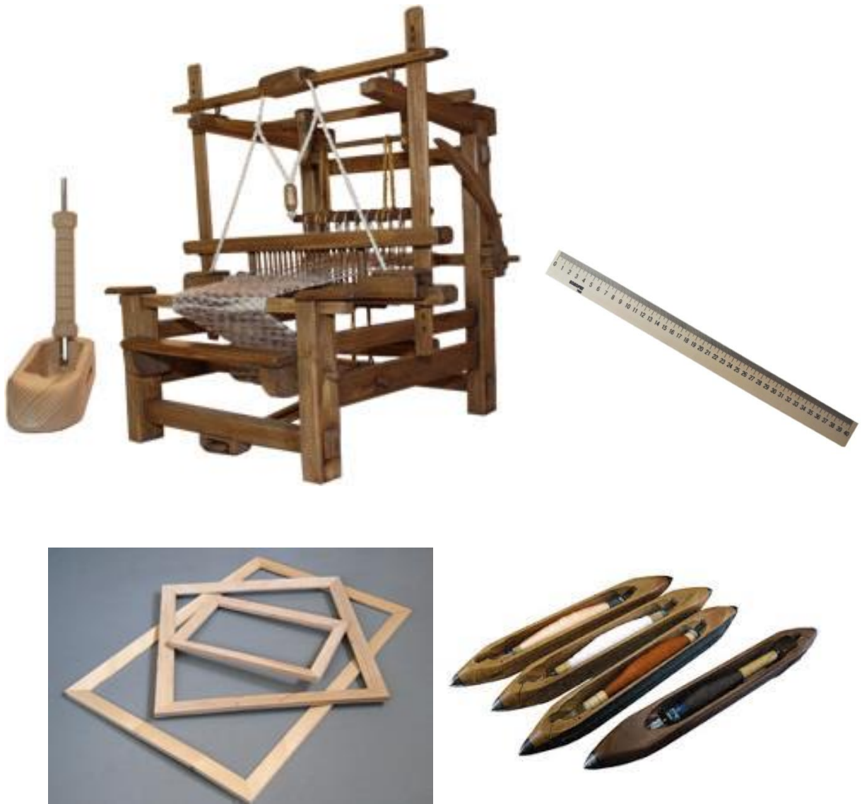
Рис. А.1.1. Інструменти та обладнання для виготовлення гобелену.