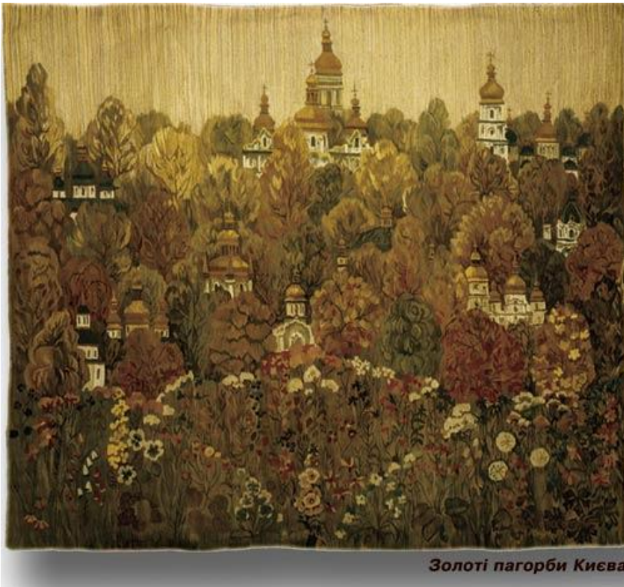
Золоті пагорби Києва